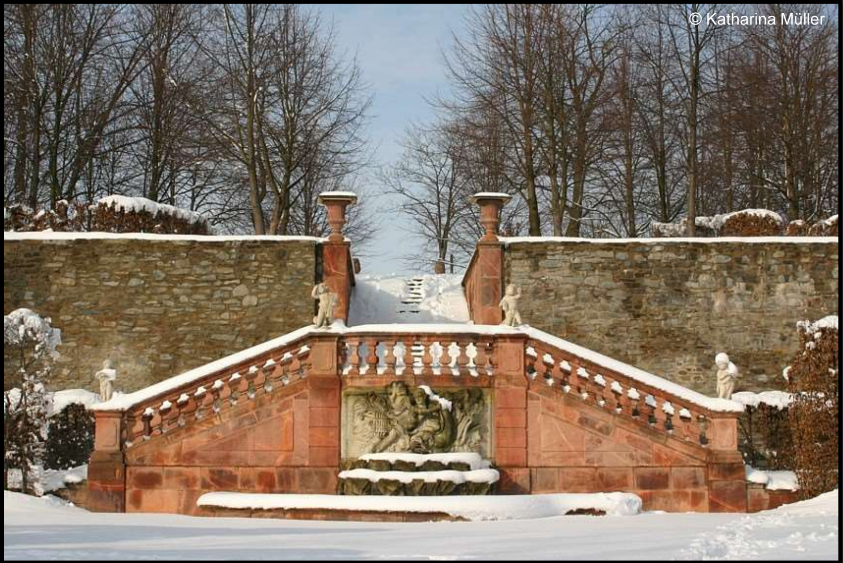
Der Delfinbrunnen am Arcadenstück