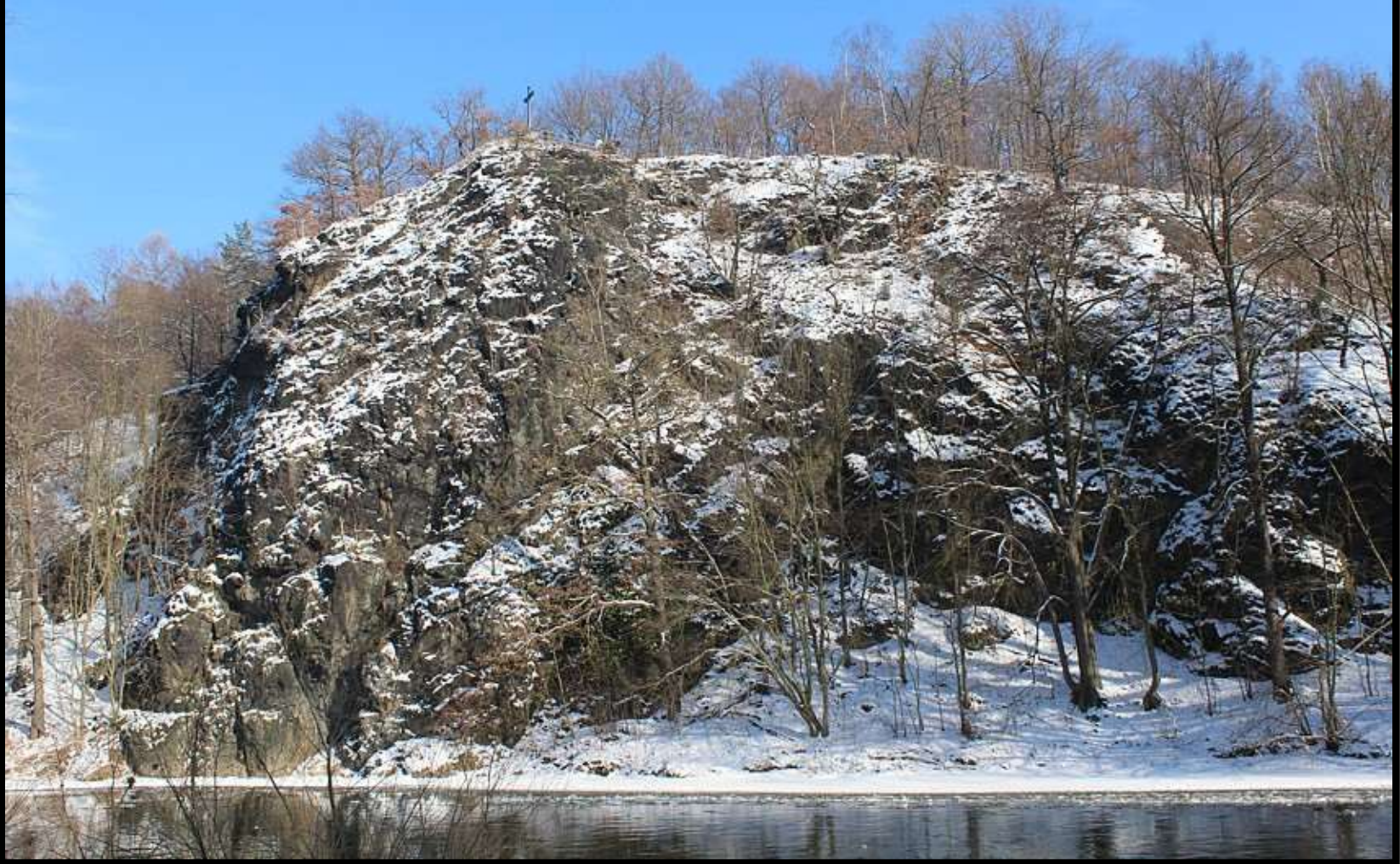
Blick zum Harrasfelsen