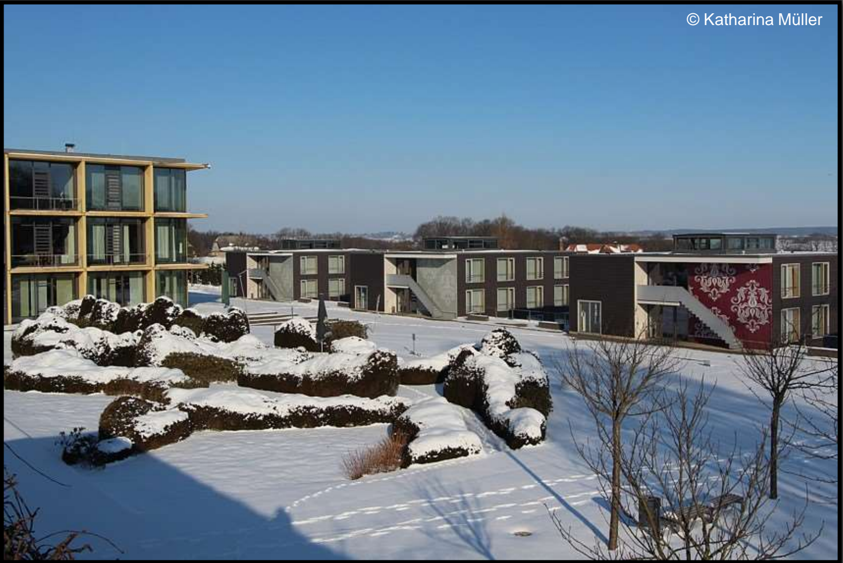
Hotel am Schlosspark