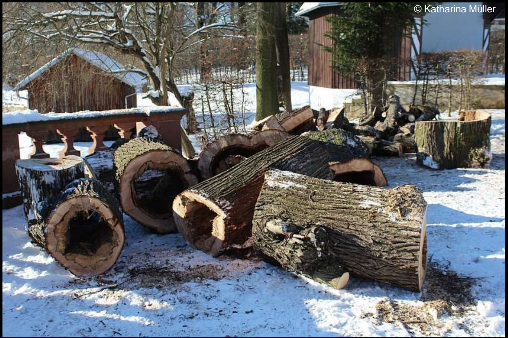
Geopferter hohler Riese am Konzertplatz