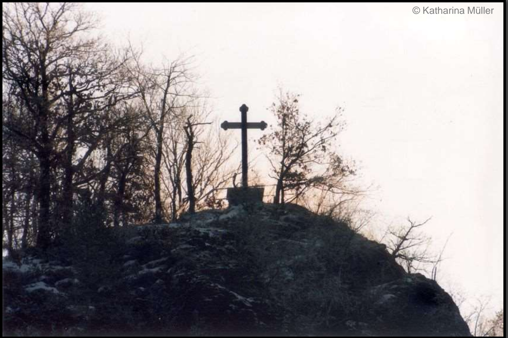
Blick zum Harrasfelsen mit Körnerkreuz