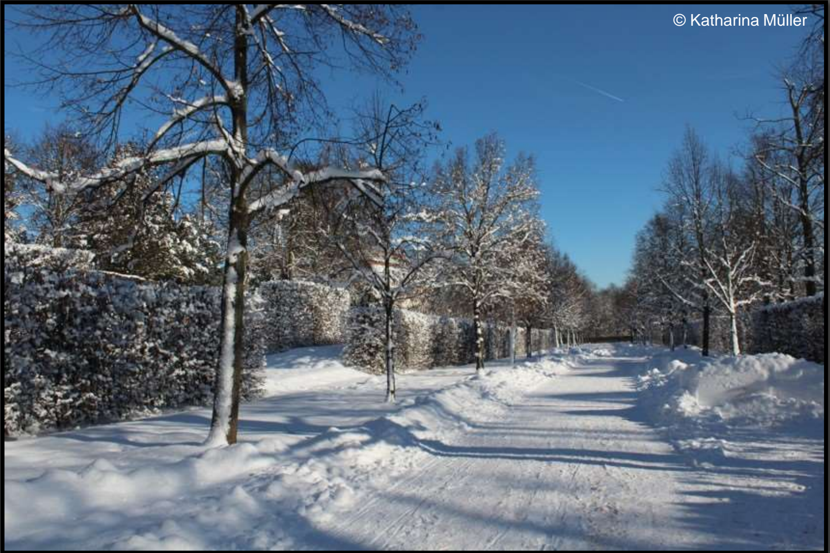
Hauptallee im Barockgarten