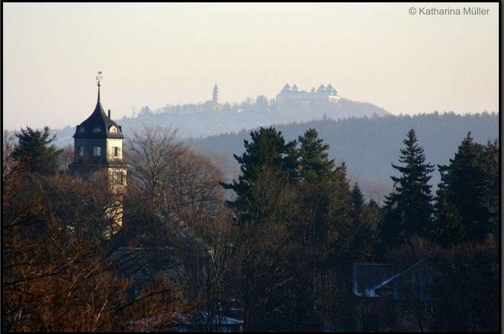
Wasserturm Braunsdorf mit der Augustusburg