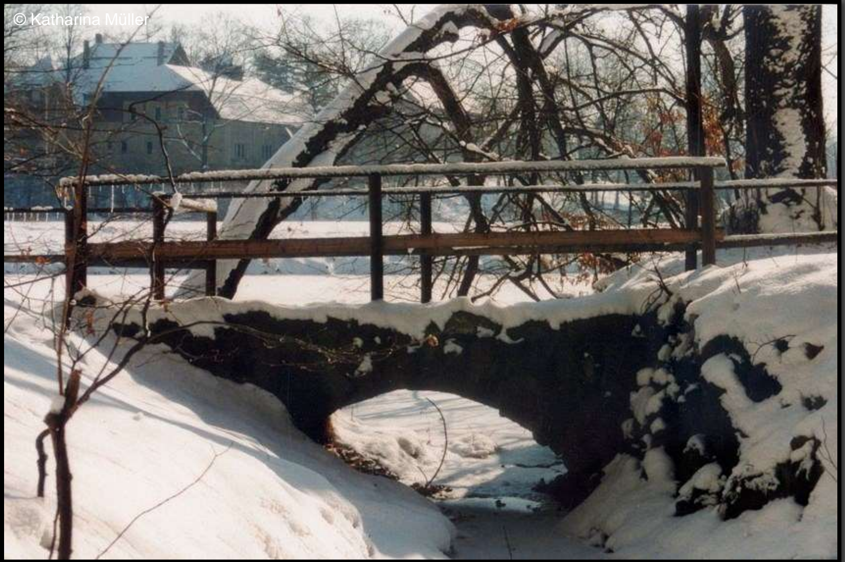
Kleine Brücke an der Parkschlucht