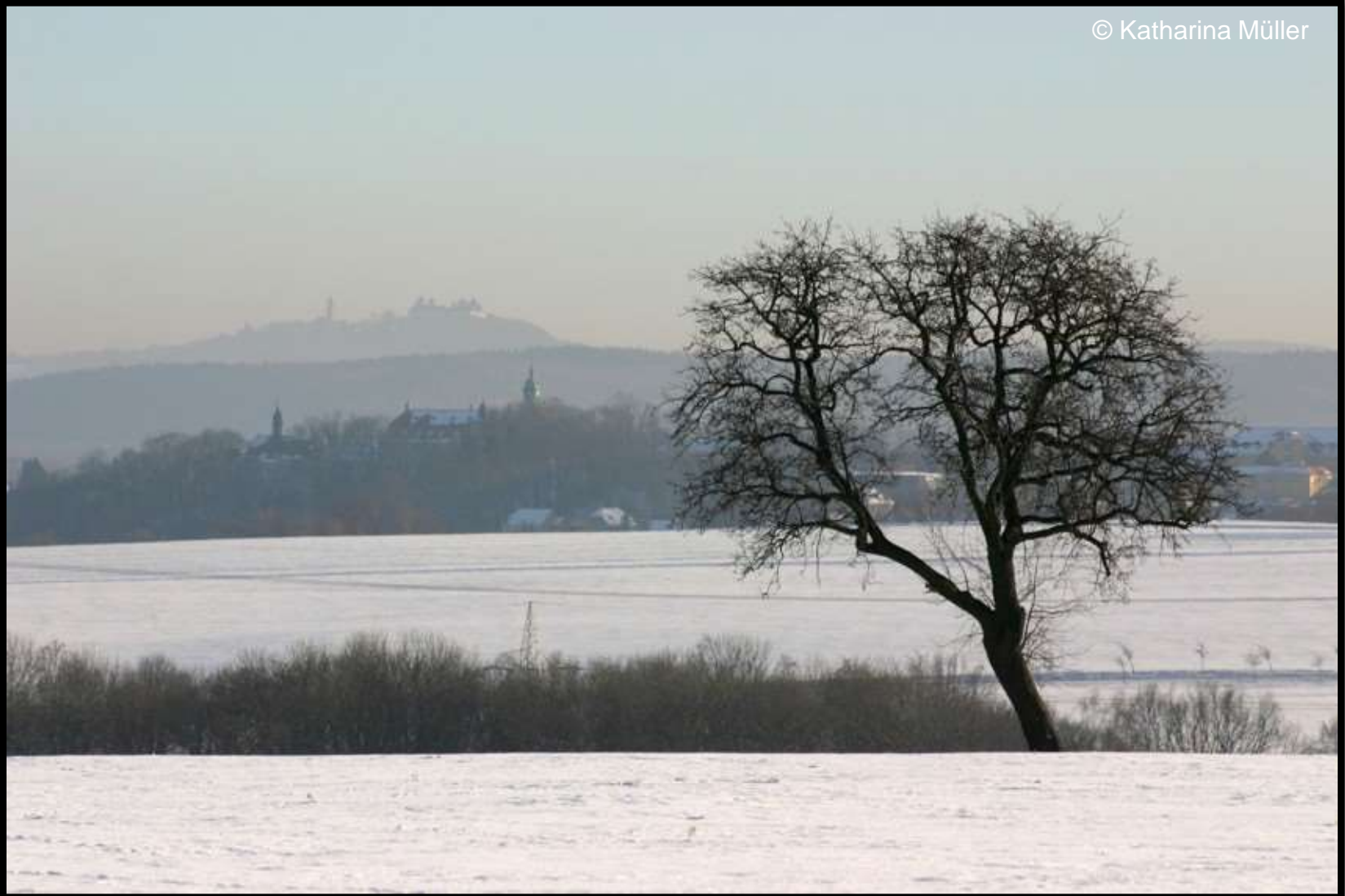
Die Schlösser Lichtenwalde und Augustusburg