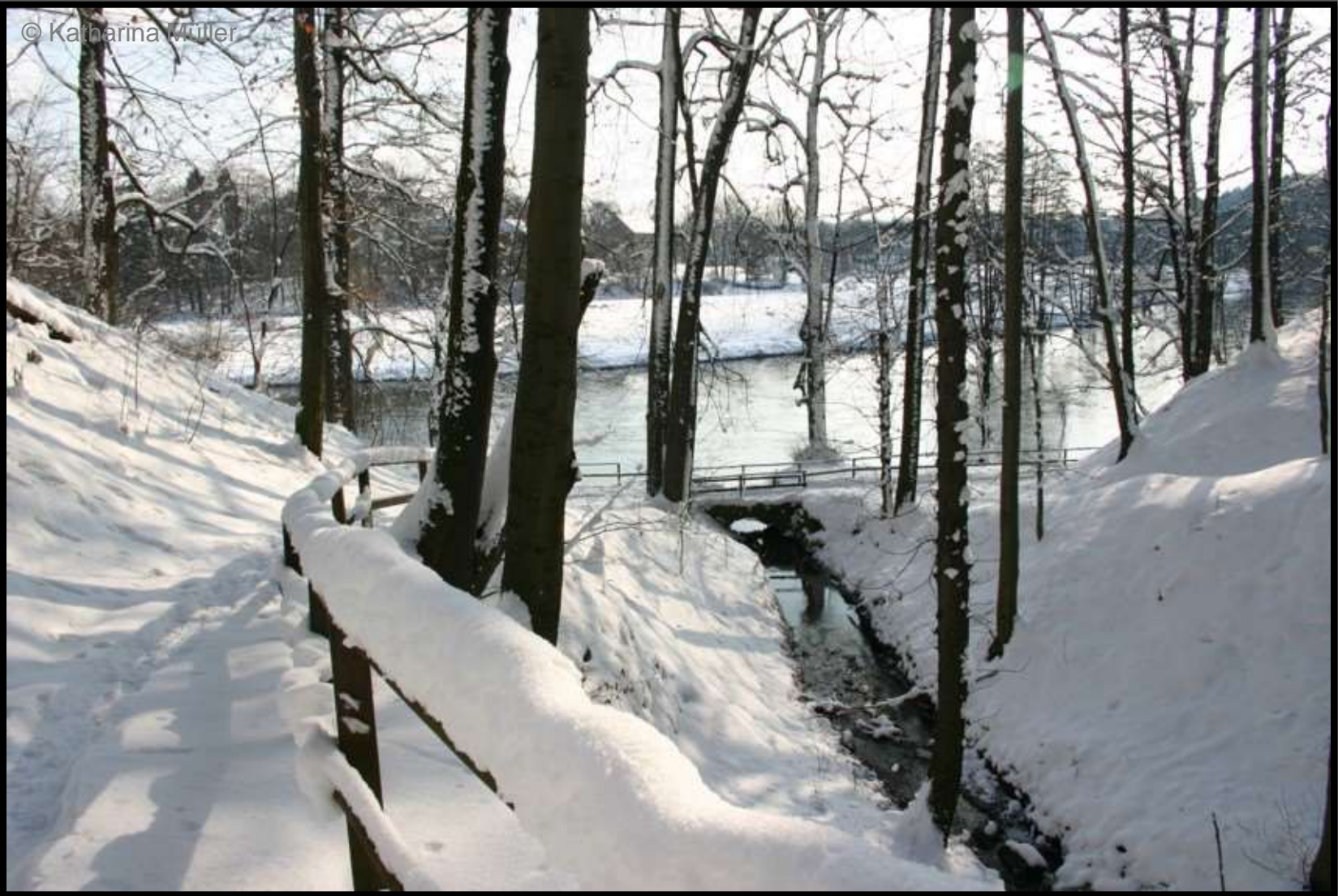
Parkschlucht zur Zschopau