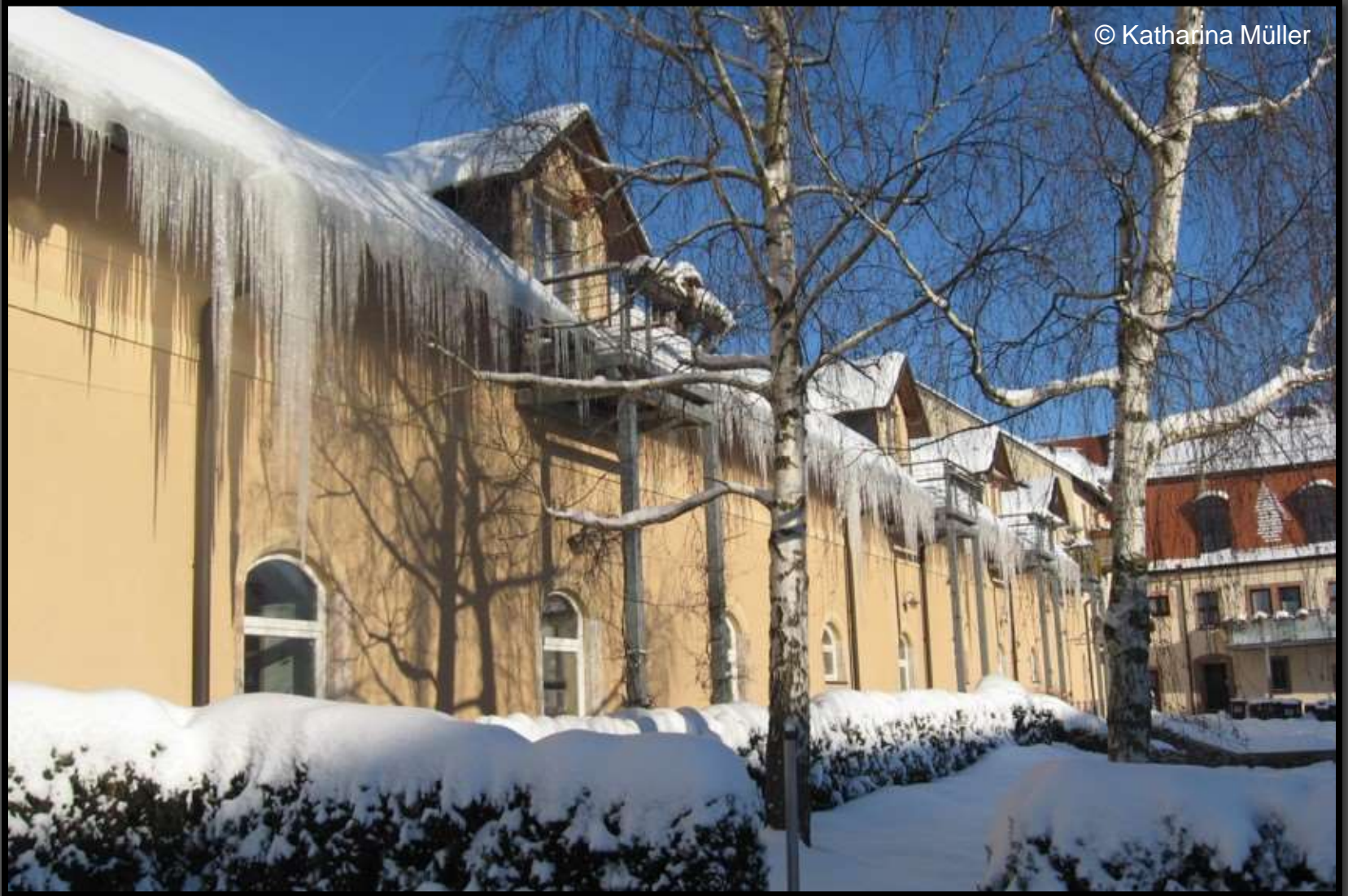
Im Rittergutshof – ehemalige Stallungen