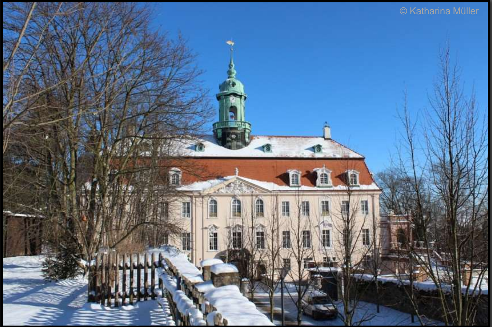
Blick vom Orangeriegelände auf Schloss Lichtenwalde