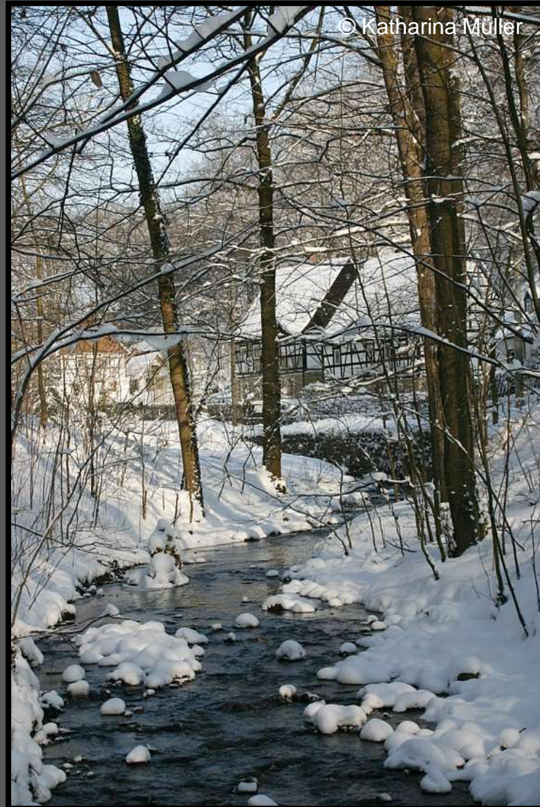
Häuser am Angerbach