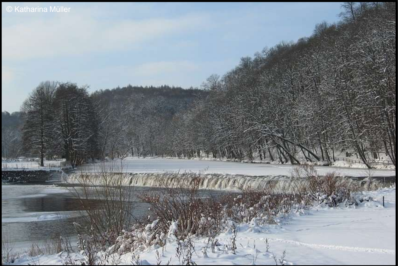
Zschopauwehr bei der Lichtenwalder Mühle