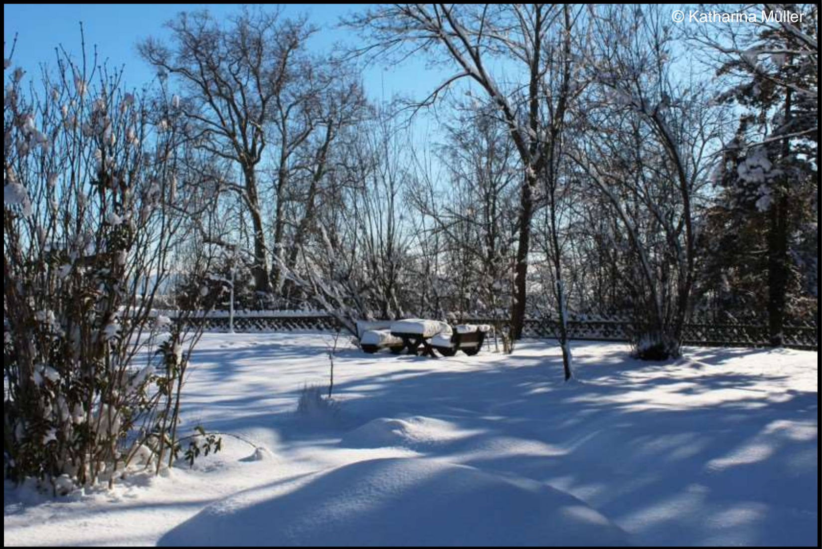
Kräutergarten im Orangeriegelände – historisch Küchengarten