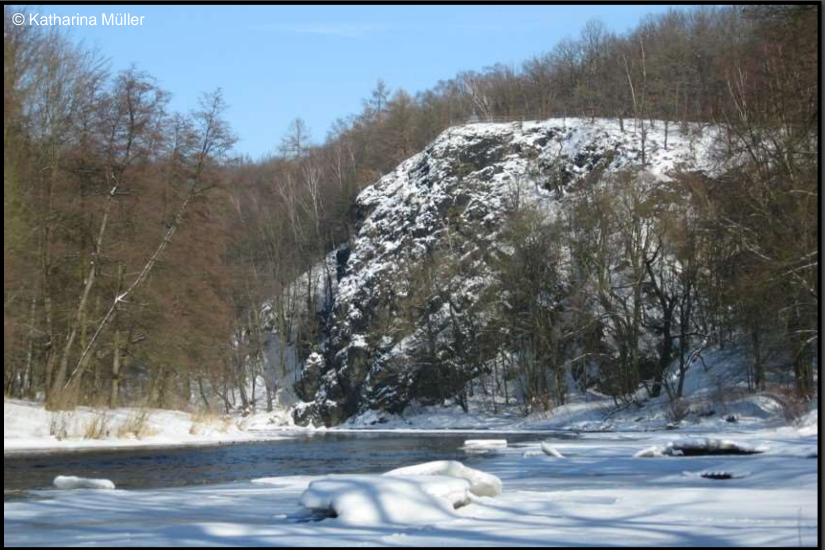
Harrasfelsen bei Lichtenwalde