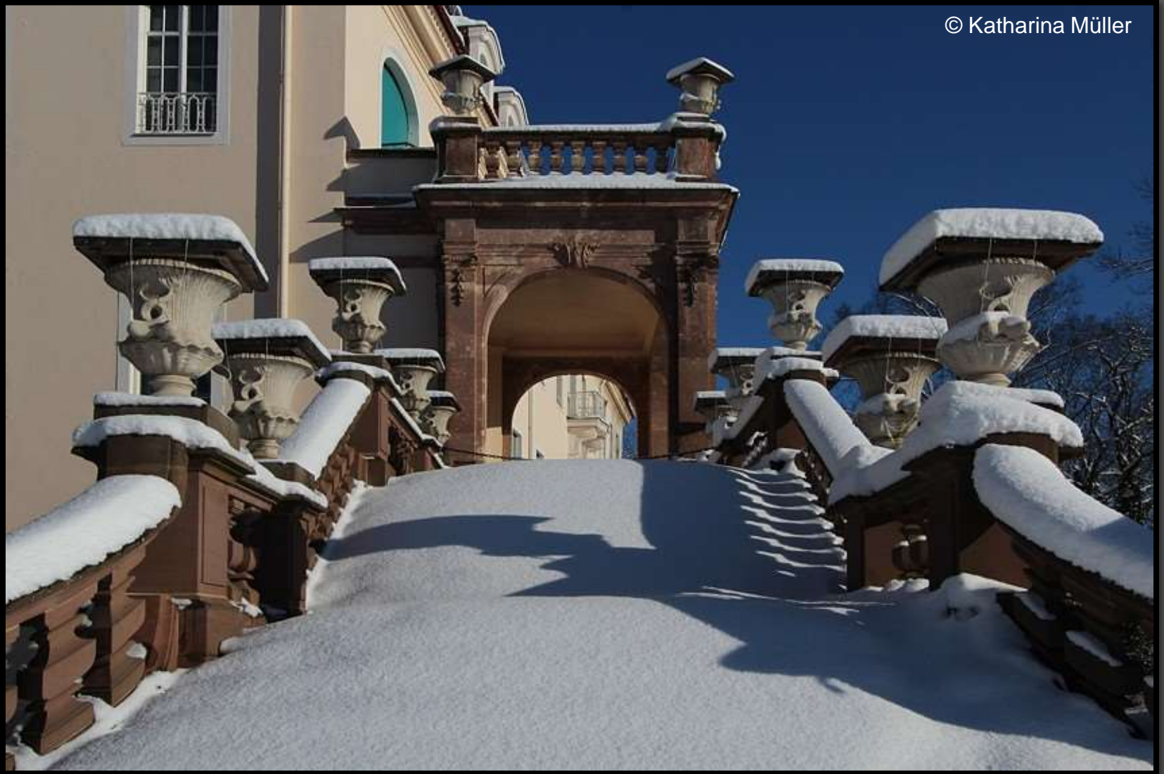
Der Altan am Schloss Lichtenwalde