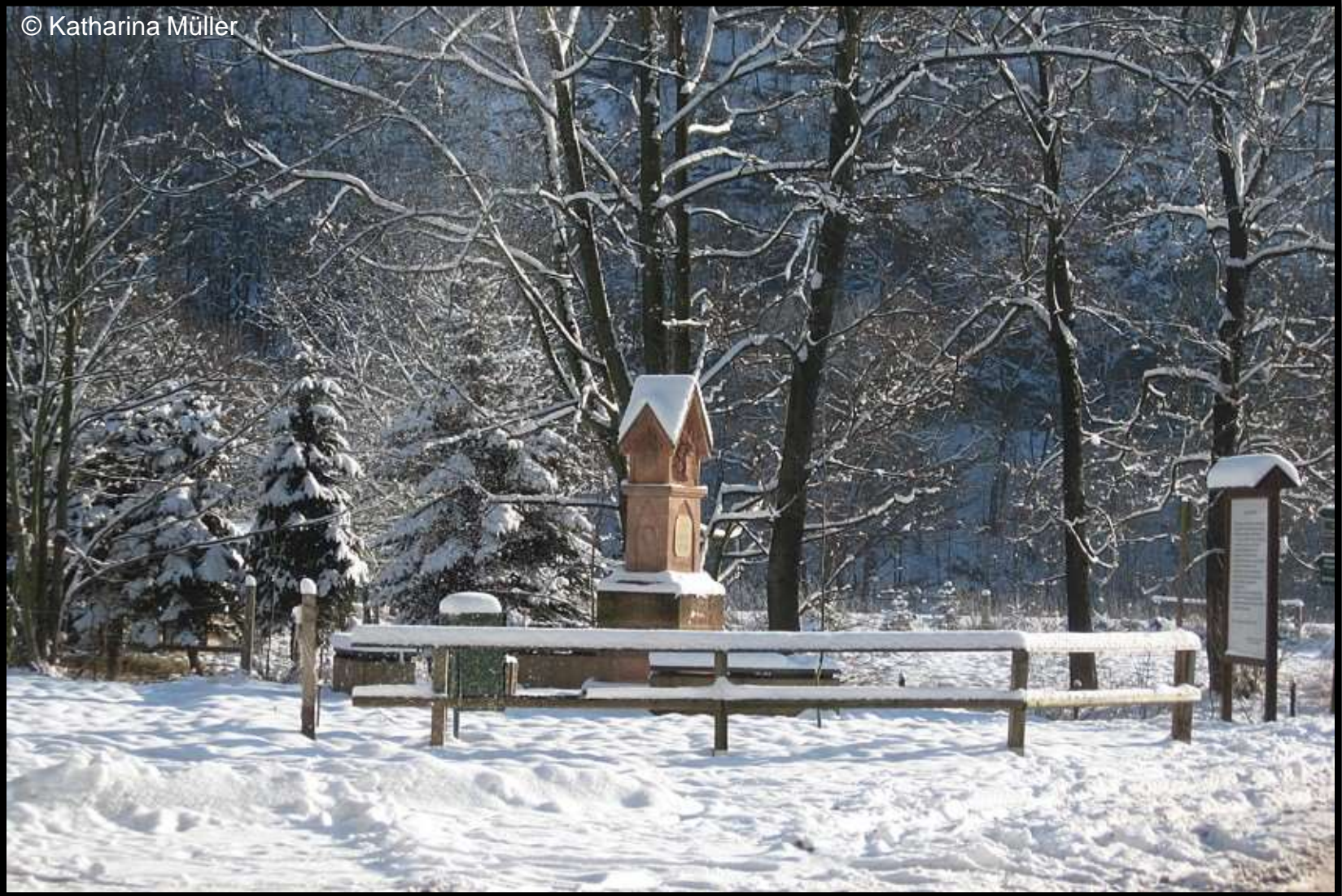
Harrasdenkmal bei der ehemaligen Mühle