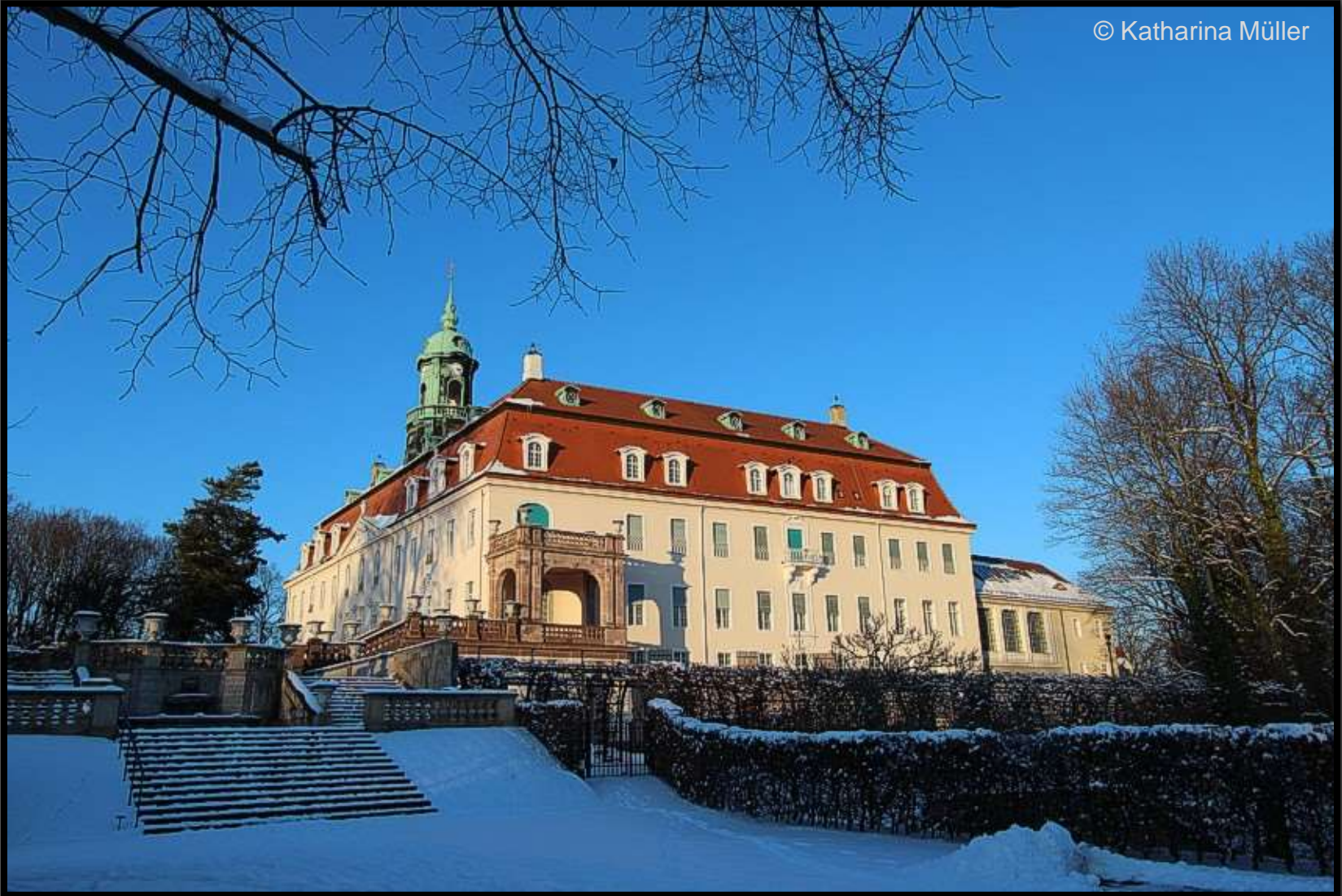
Schloss Lichtenwalde - Südseite