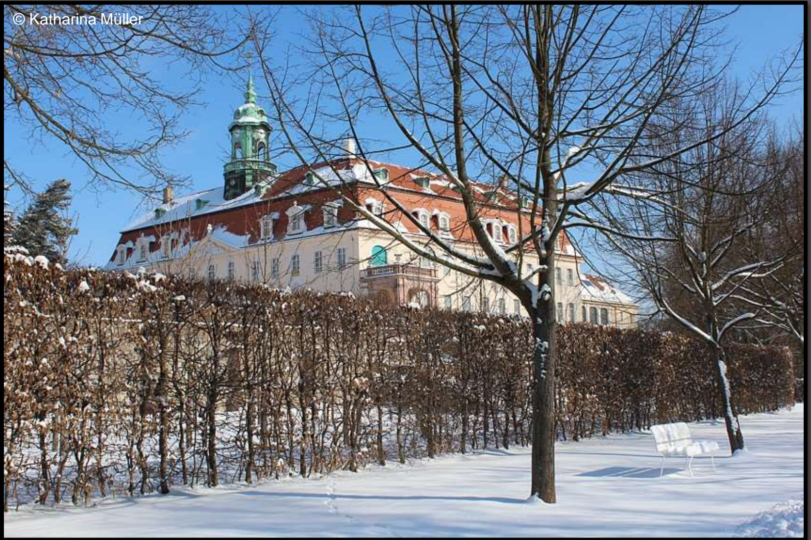
Schlossblick von der Hauptallee im Barockgarten