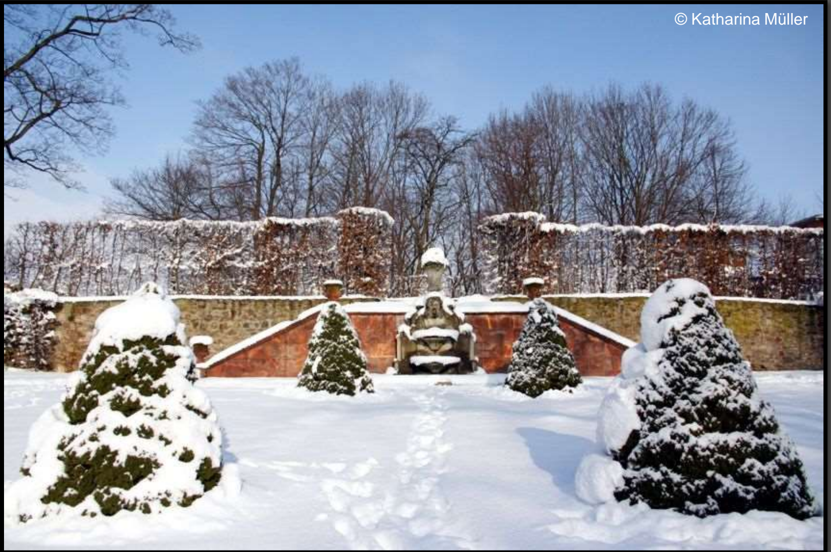
Oberer Teil des Neuen Stückes