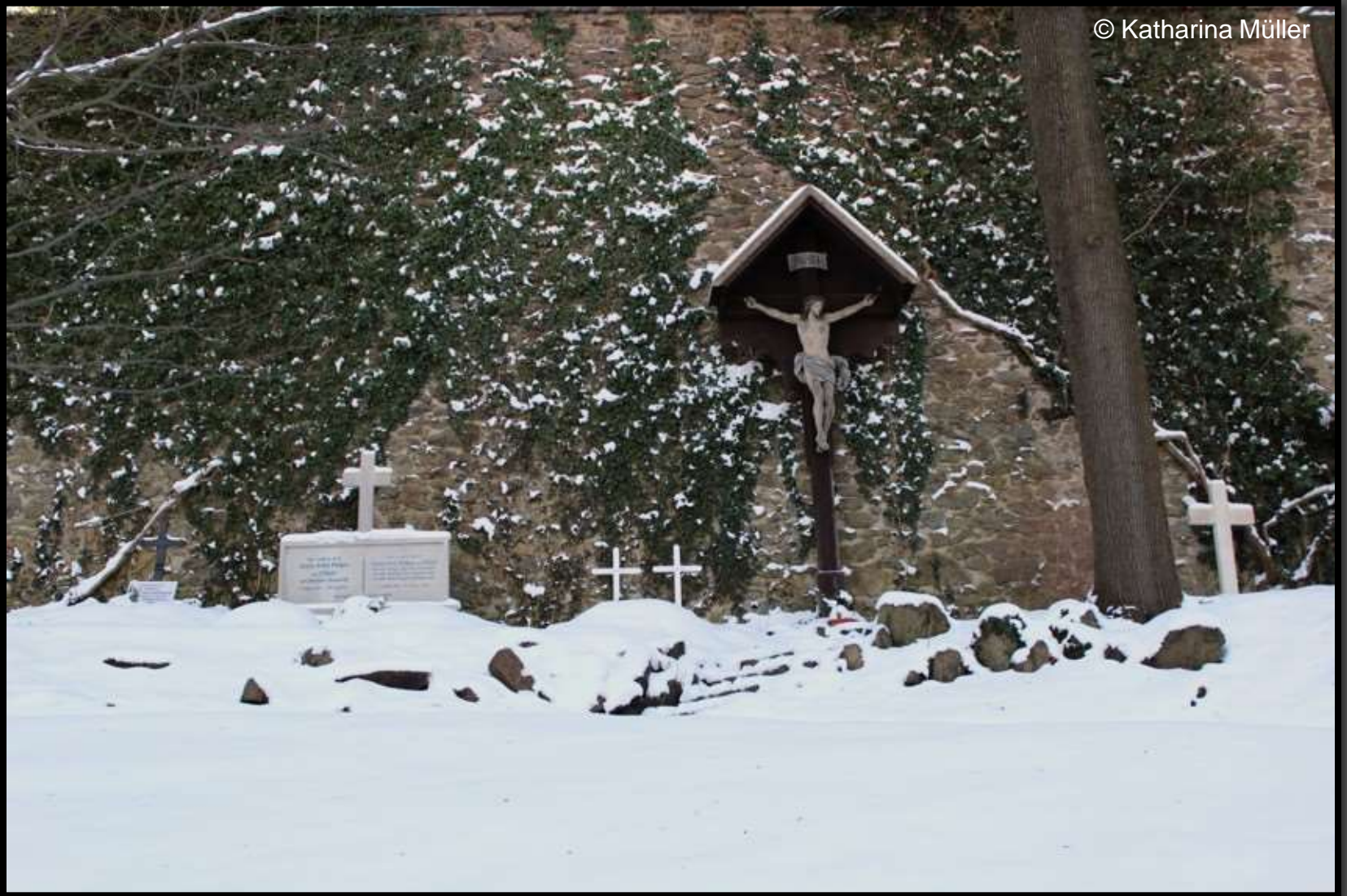
Der Gräfliche Friedhof