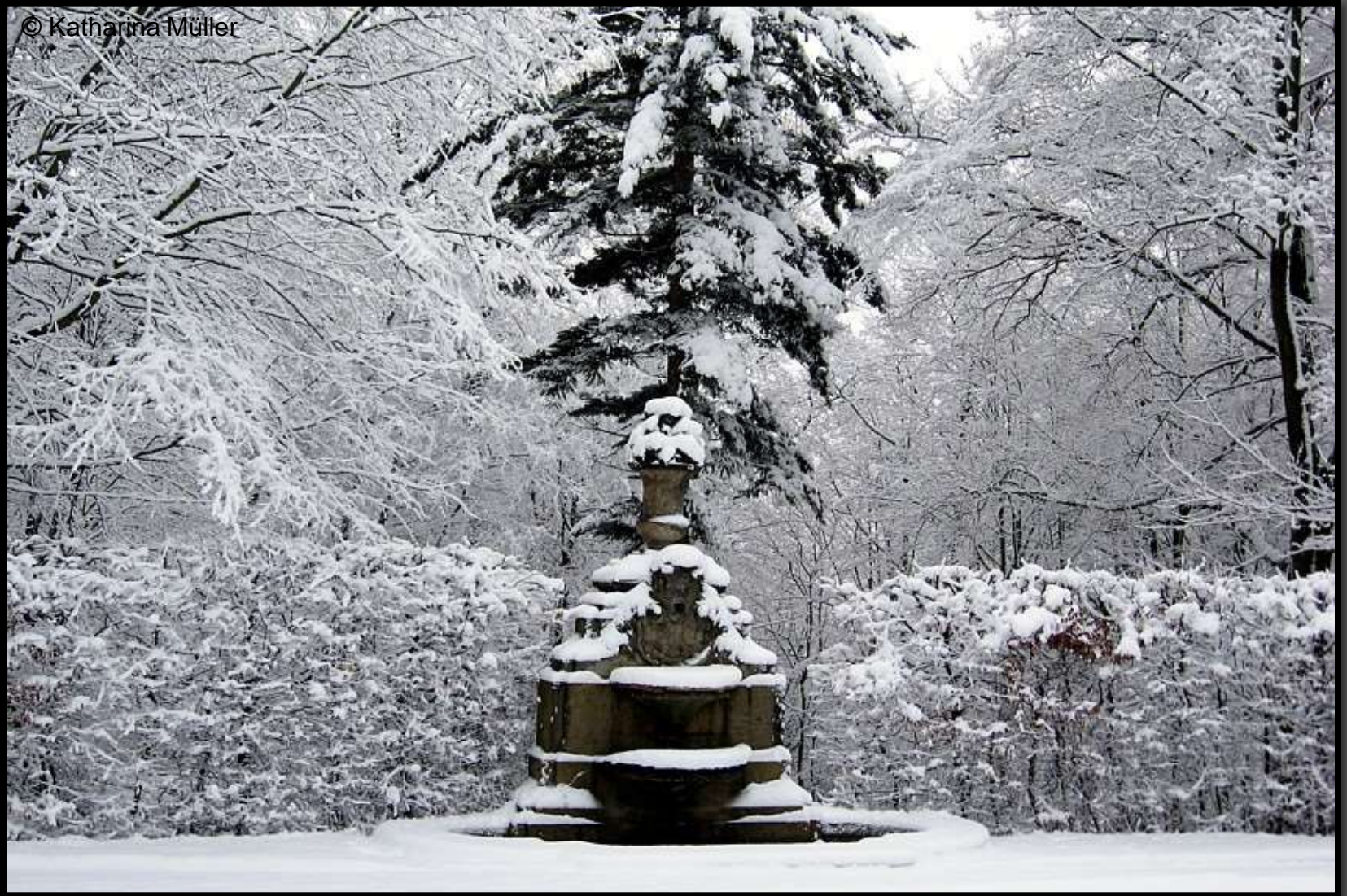
Das Neue Stück - Unterer Brunnen