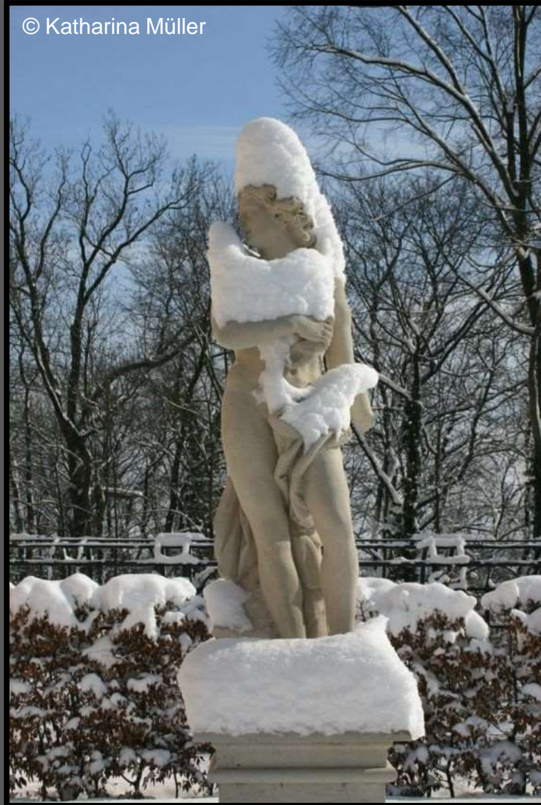
Skulptur im Winterschmuck