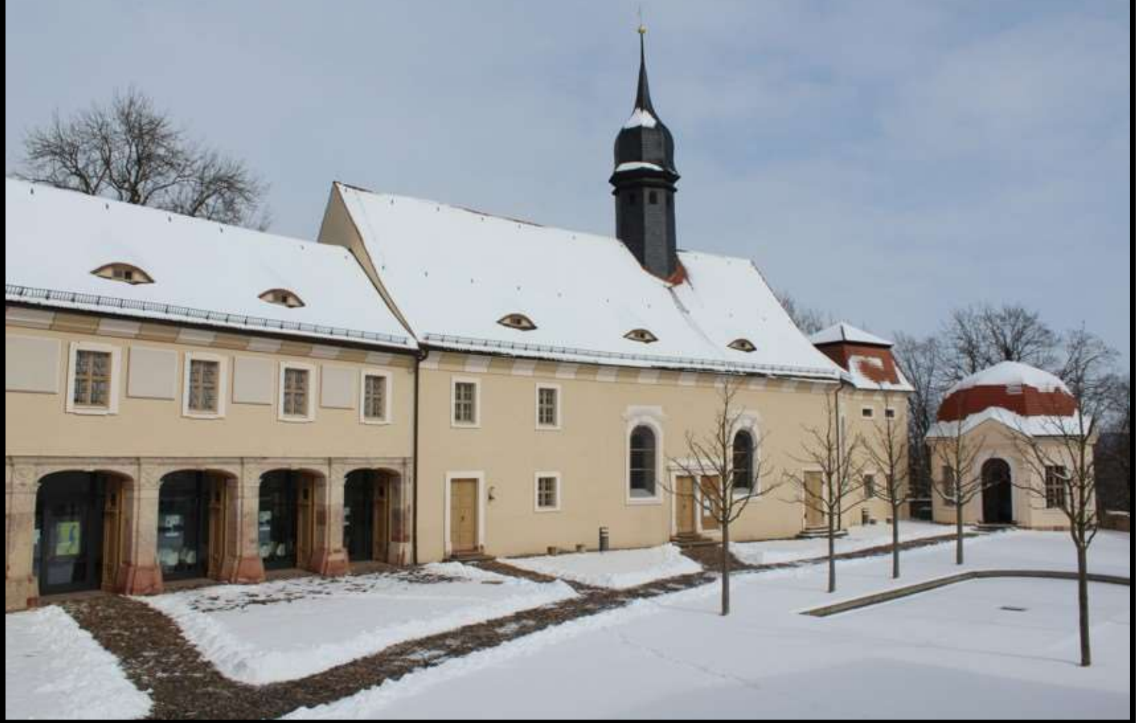
Schlossinnenhof mit Remisen, Kapelle und Teehaus