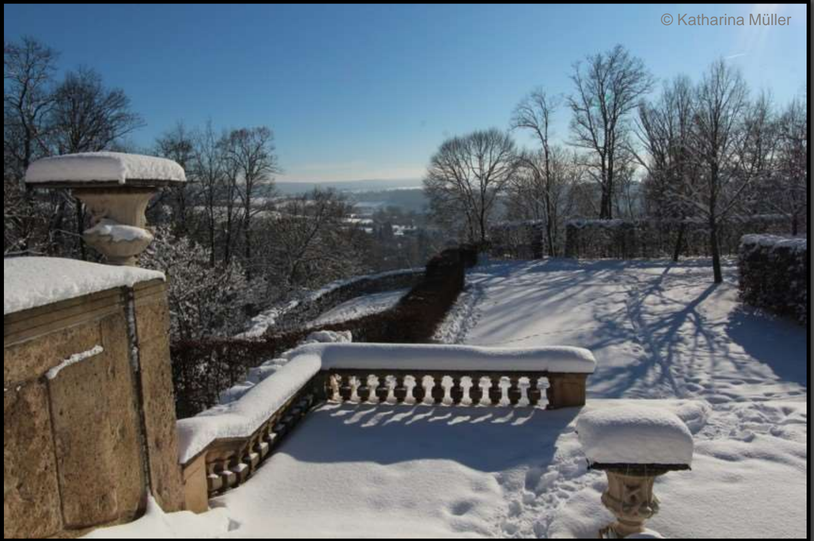
Talblick am Süd-West-Abgang