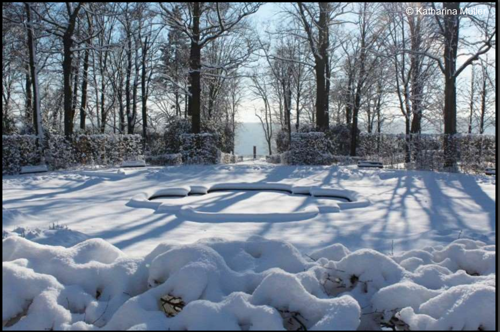
Blick von der Hauptallee über das Vasenstück