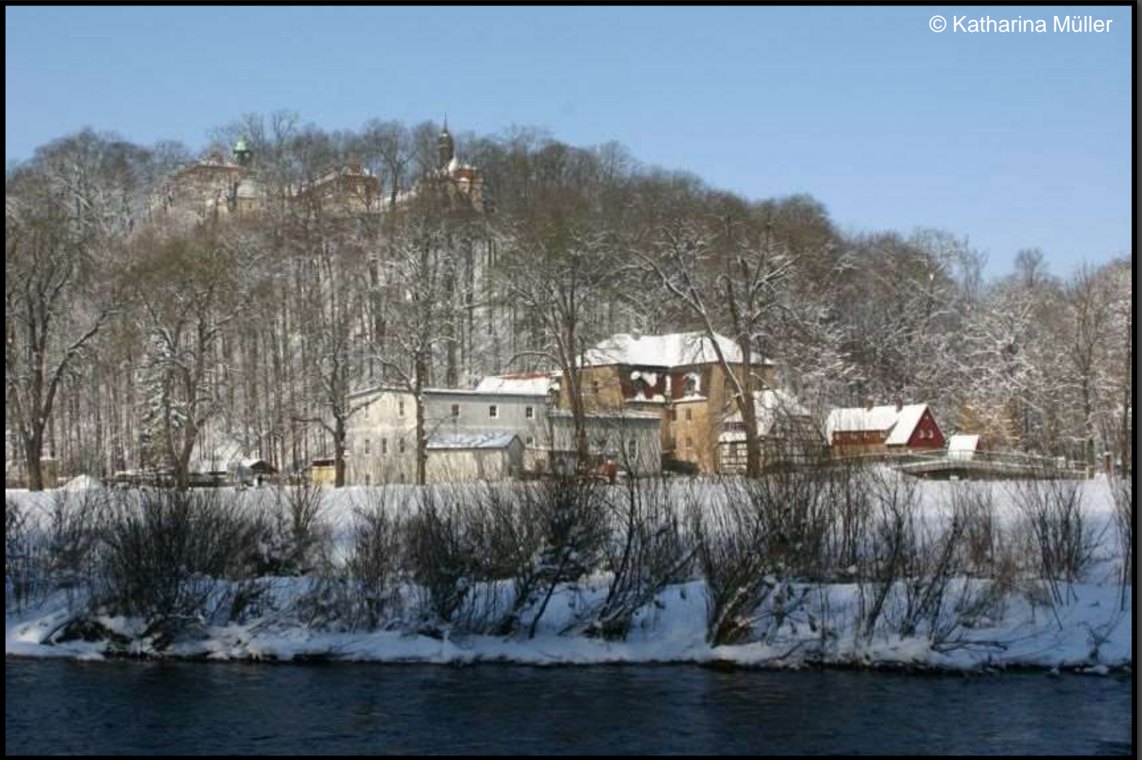
Zschopau bei Lichtenwalde mit Schloss und Mühle