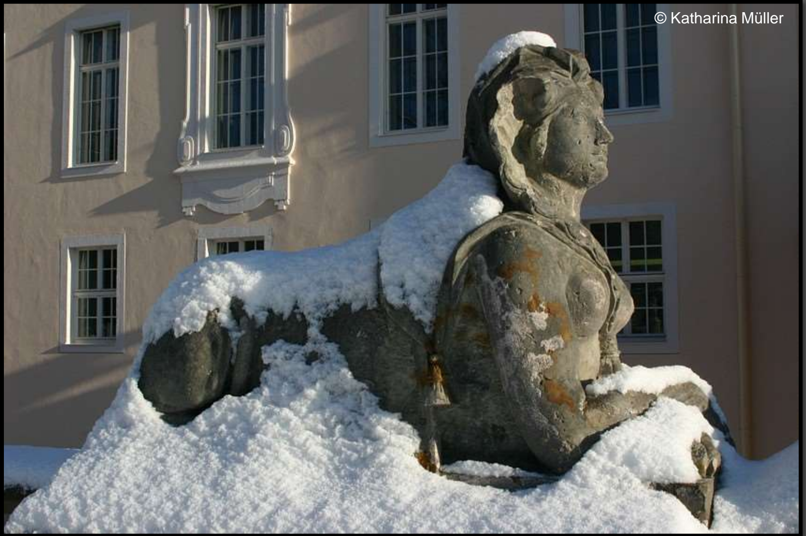
Sphinx - Wächter am Altan