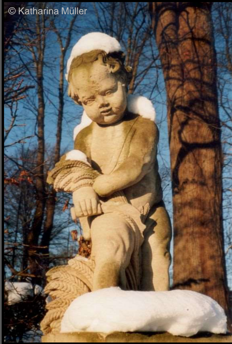
Putte im Barockgarten