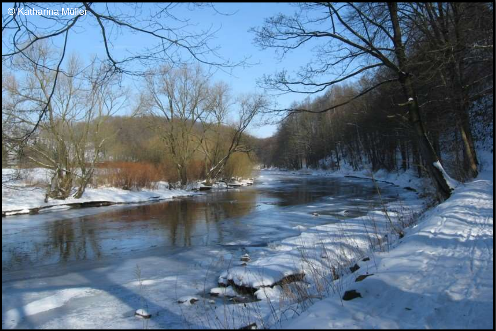
Zschopau bei der Lichtenwalder Mühle