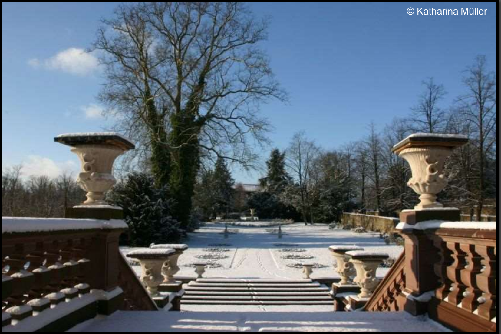
Blick vom Altan in den Mittelgarten