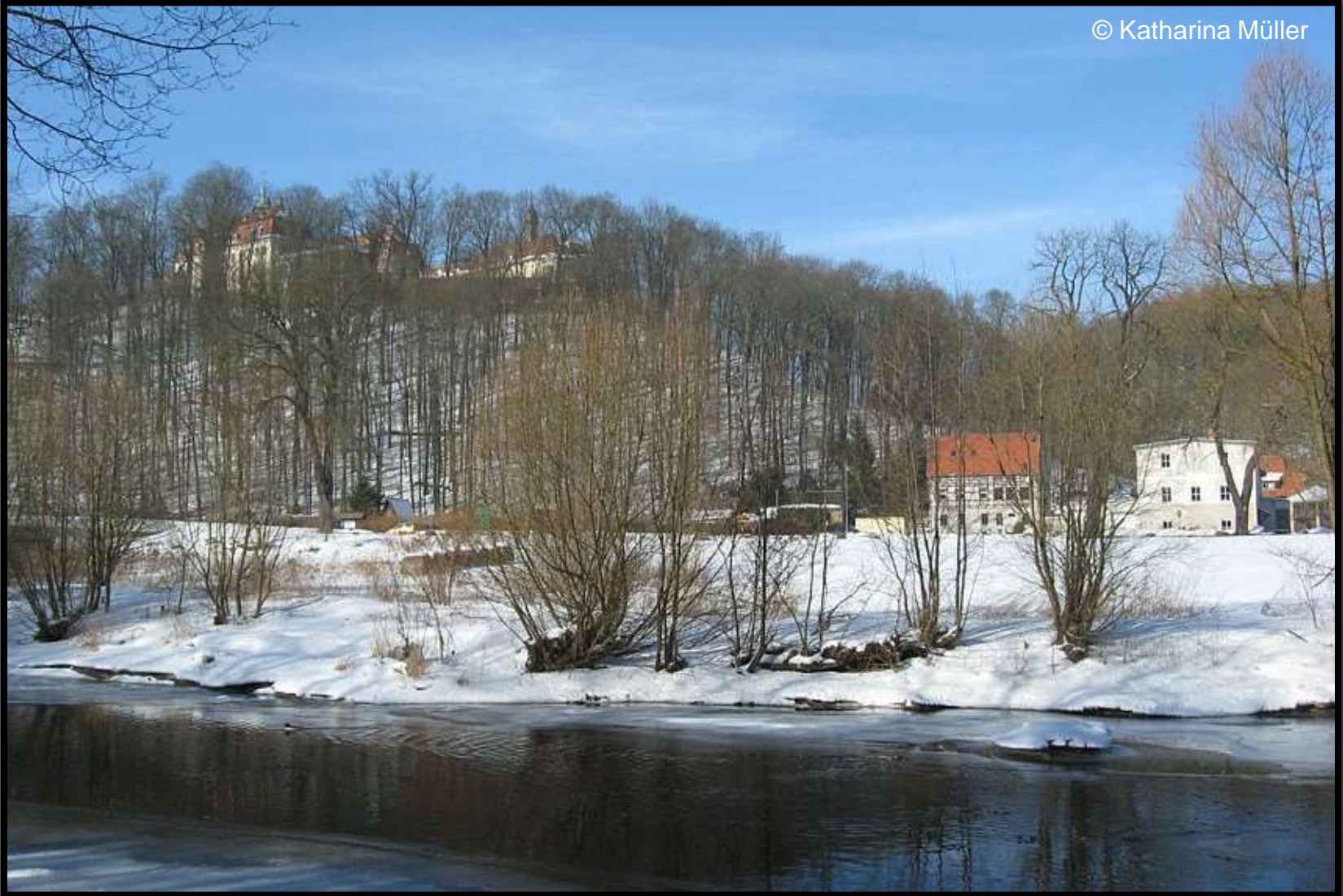
Schloss Lichtenwalde und Mühle