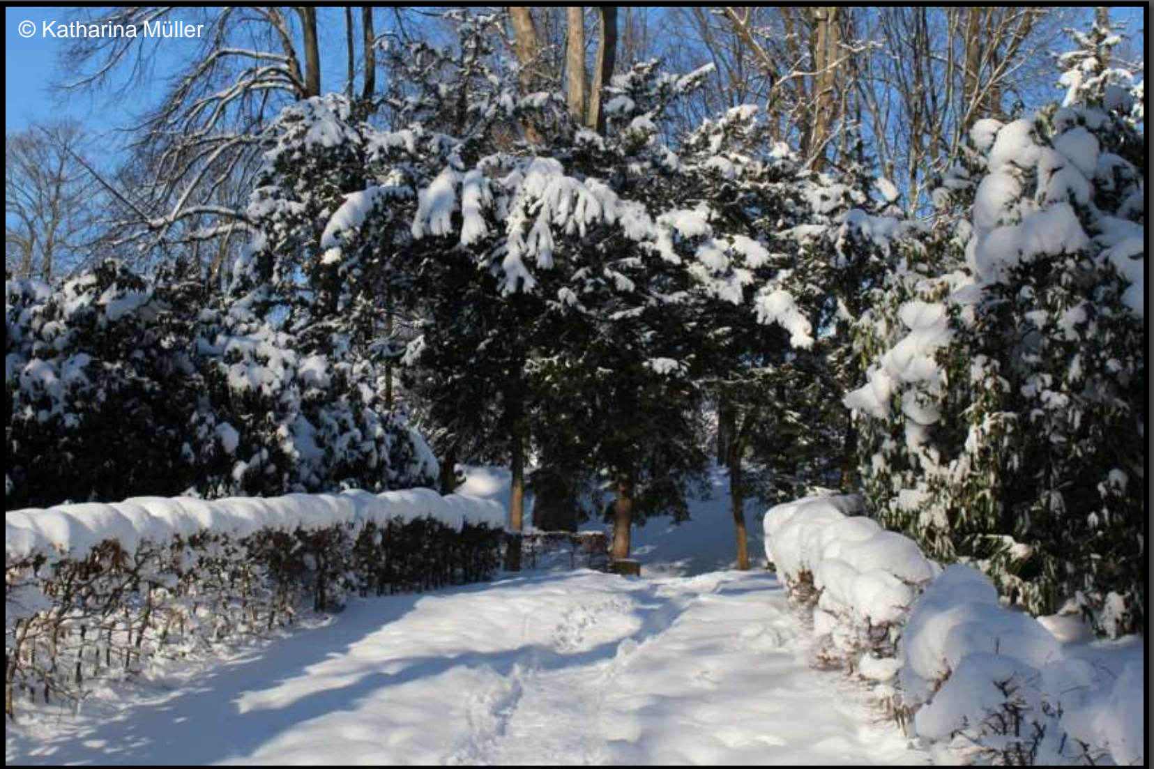
Winterzauber im Barockgarten