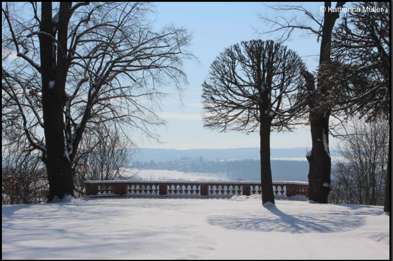
Balustrade am Konzertplatz