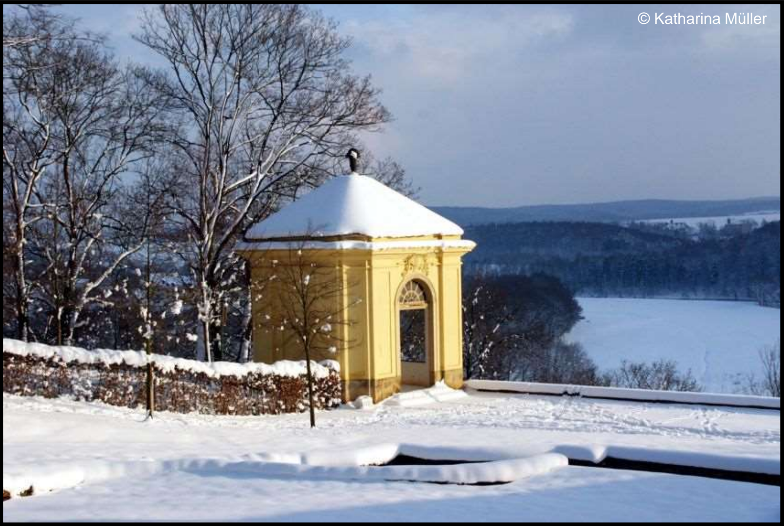
Pavillon am Großen Fer à Cheval