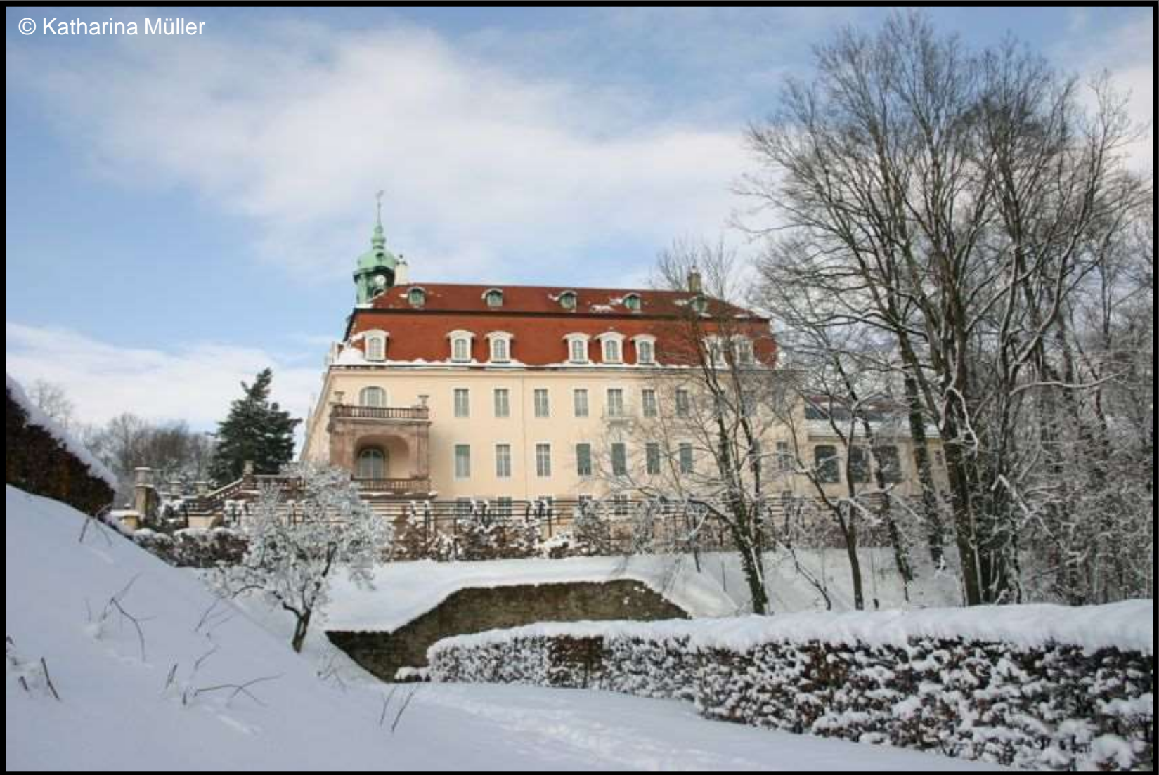
Blick zum Schloss Lichtenwalde vom Schneckengang