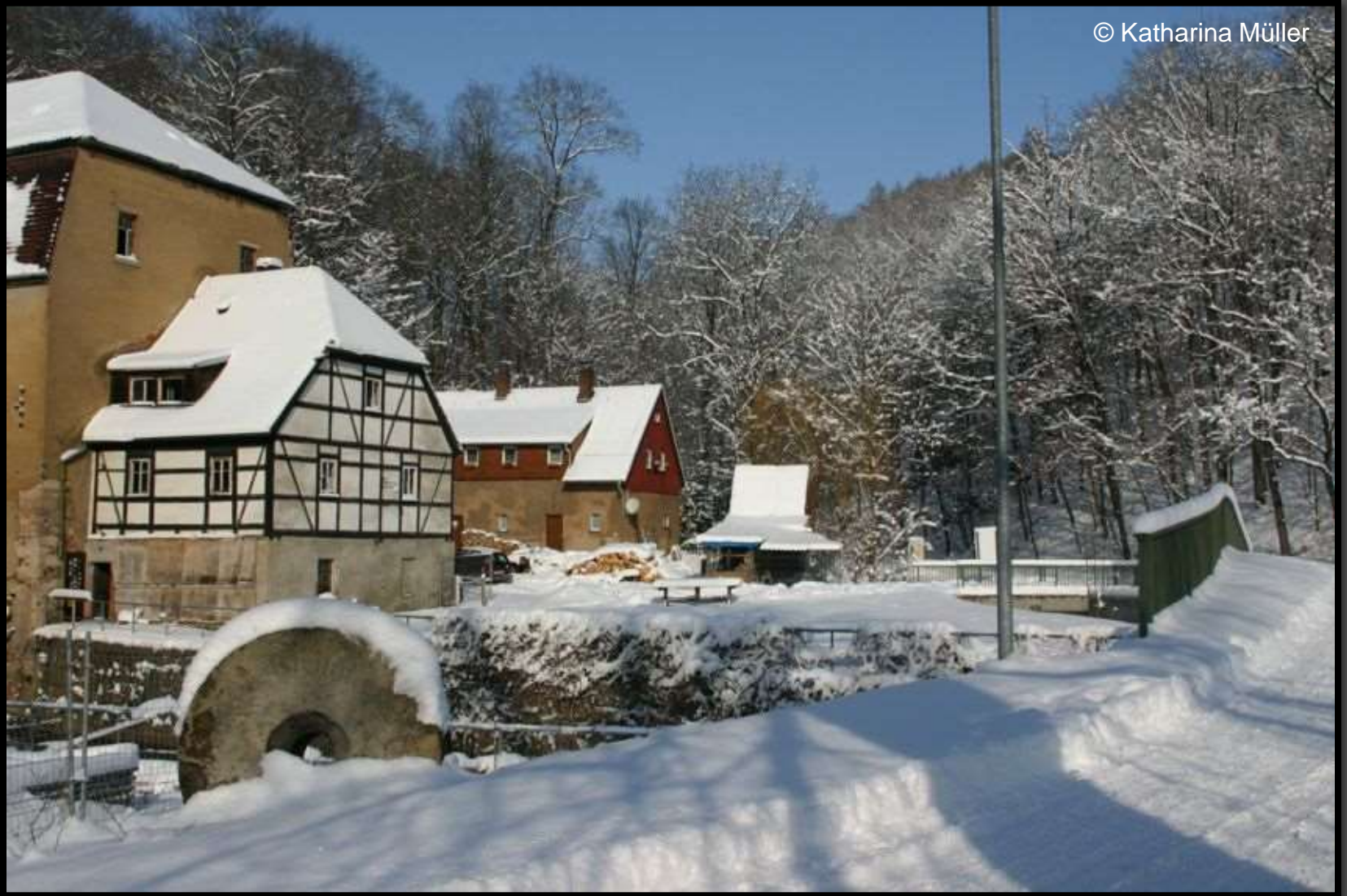
An der Schlossmühle