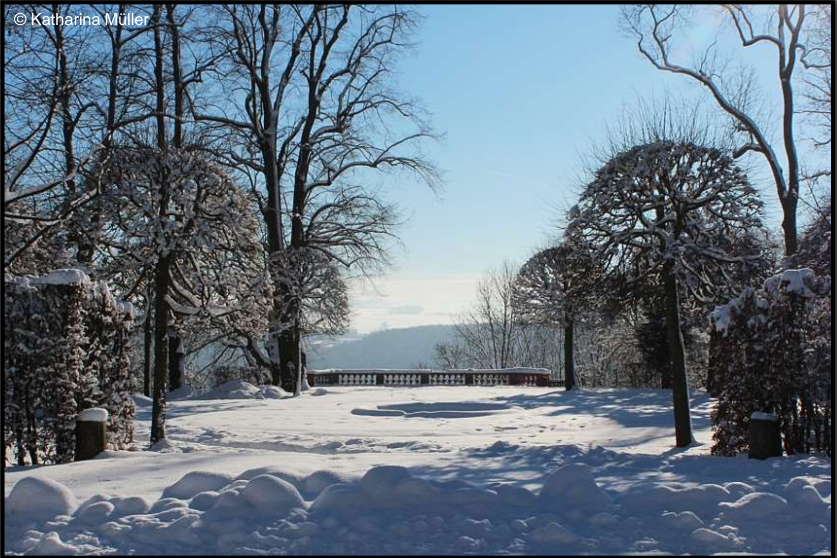
Konzertplatz im Barockgarten Lichtenwalde