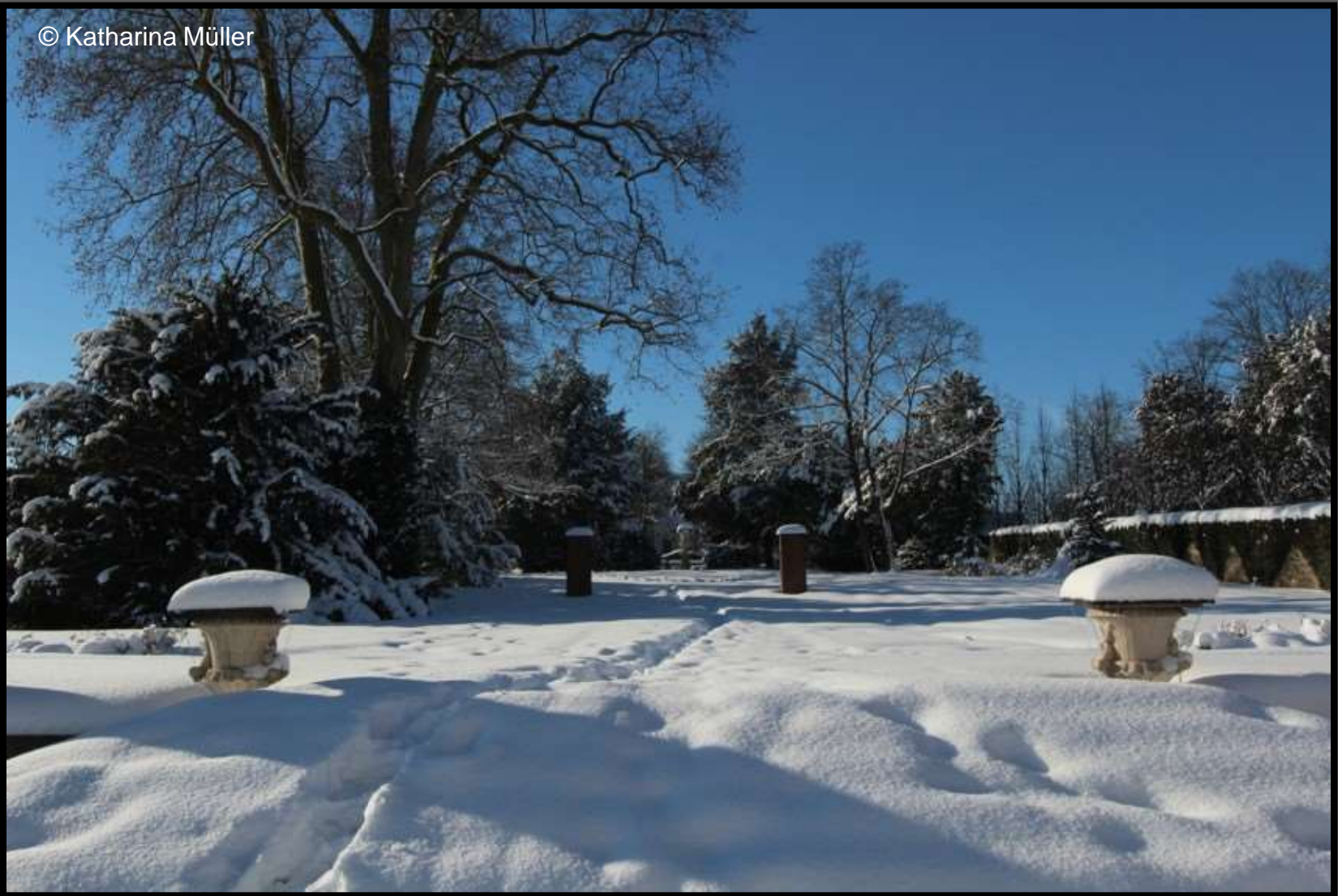
Barockgarten Lichtenwalde - Der Mittelgarten