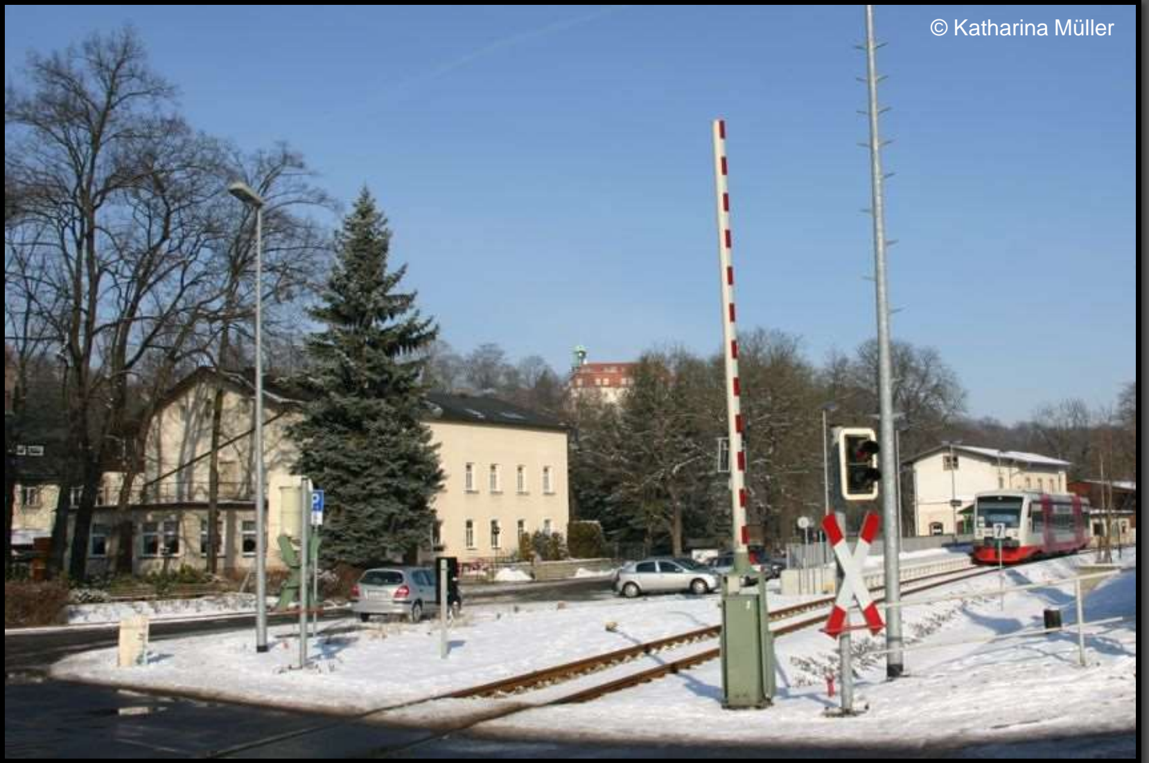
Bahnhof Braunsdorf und Schloss