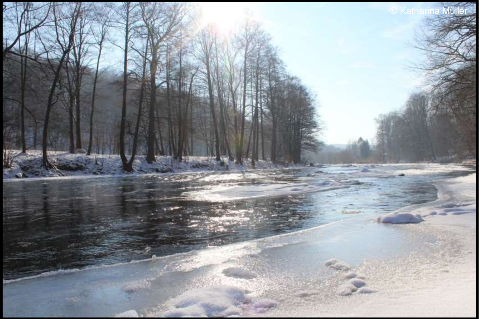
Zschopau bei Lichtenwalde