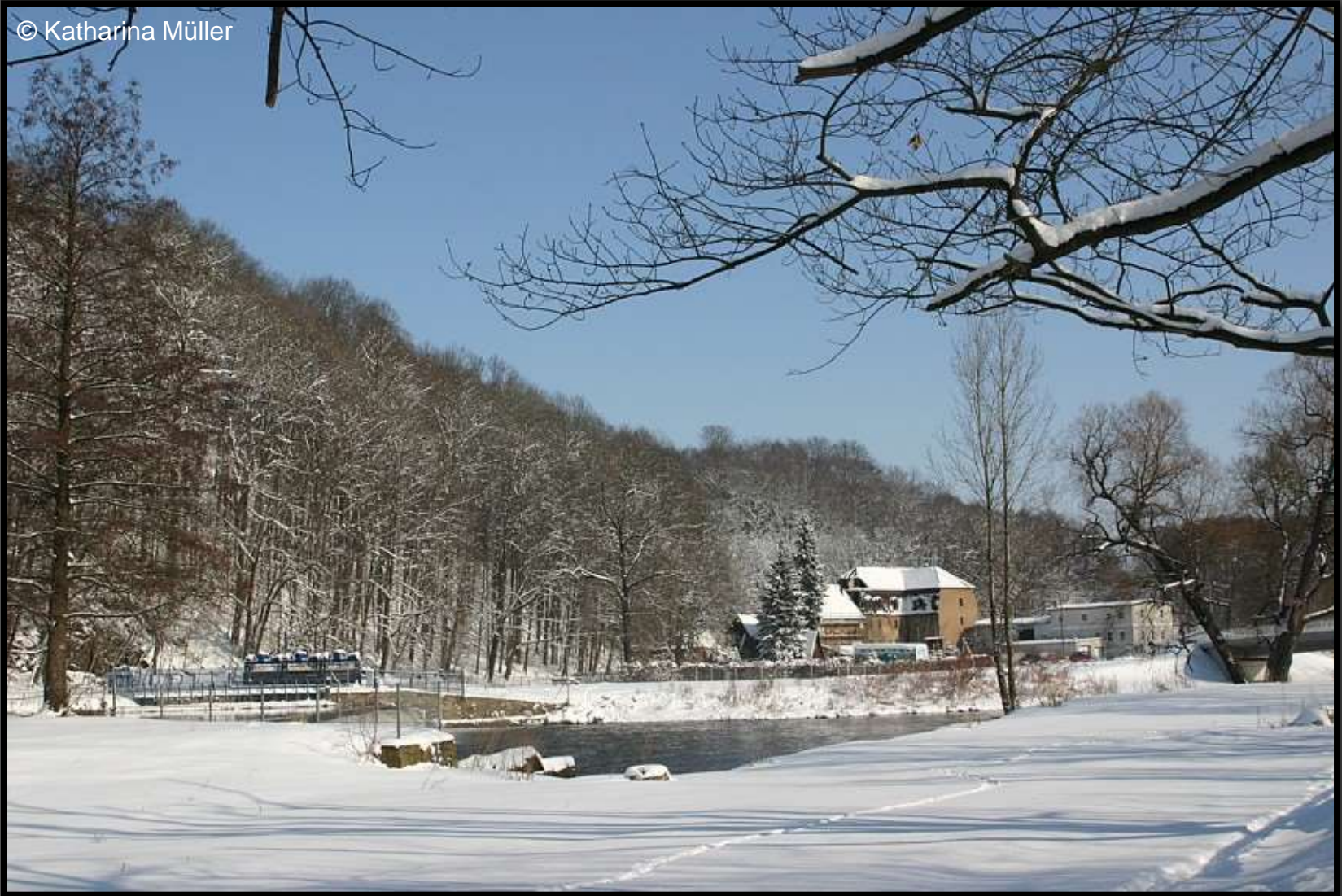
Zschopauwehr und Mühle bei Lichtenwalde