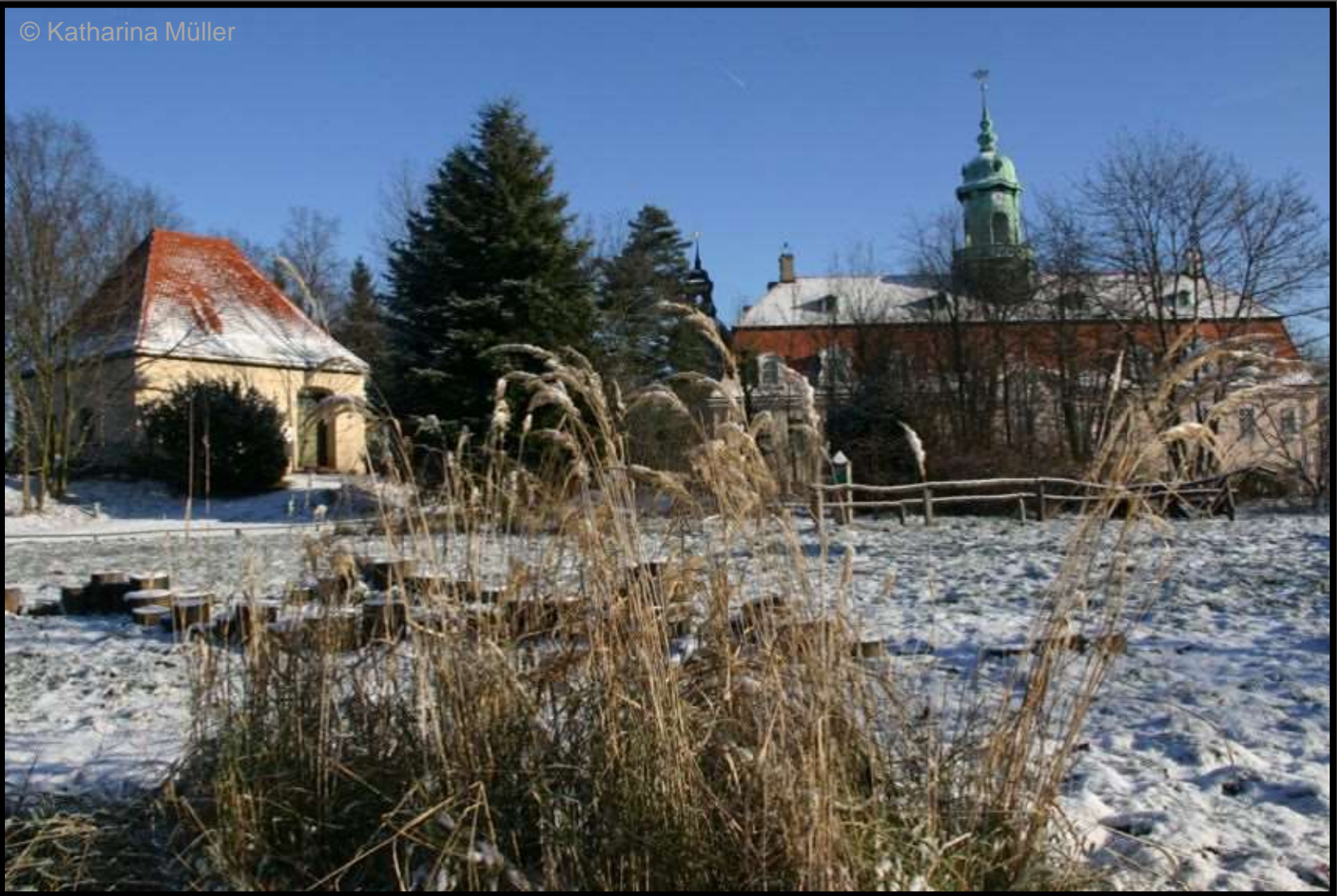
Kellerhaus mit Schloss