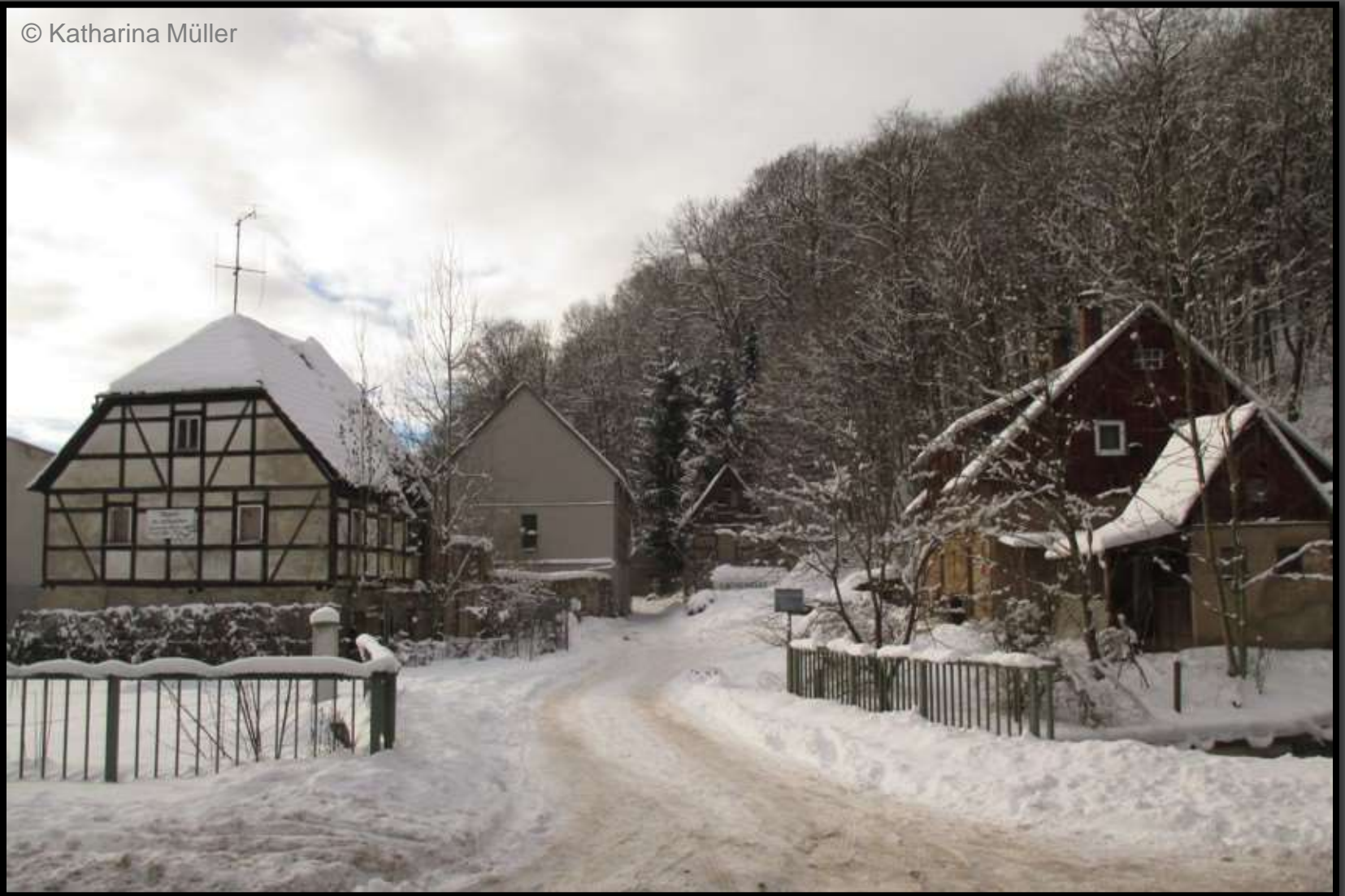
Blick in den Mühlenhof