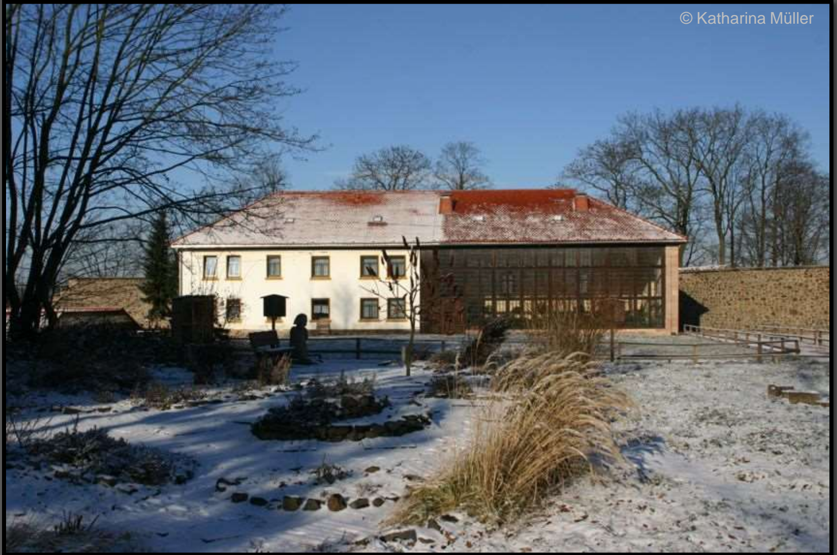
Orangeriegebäude und Kräutergarten