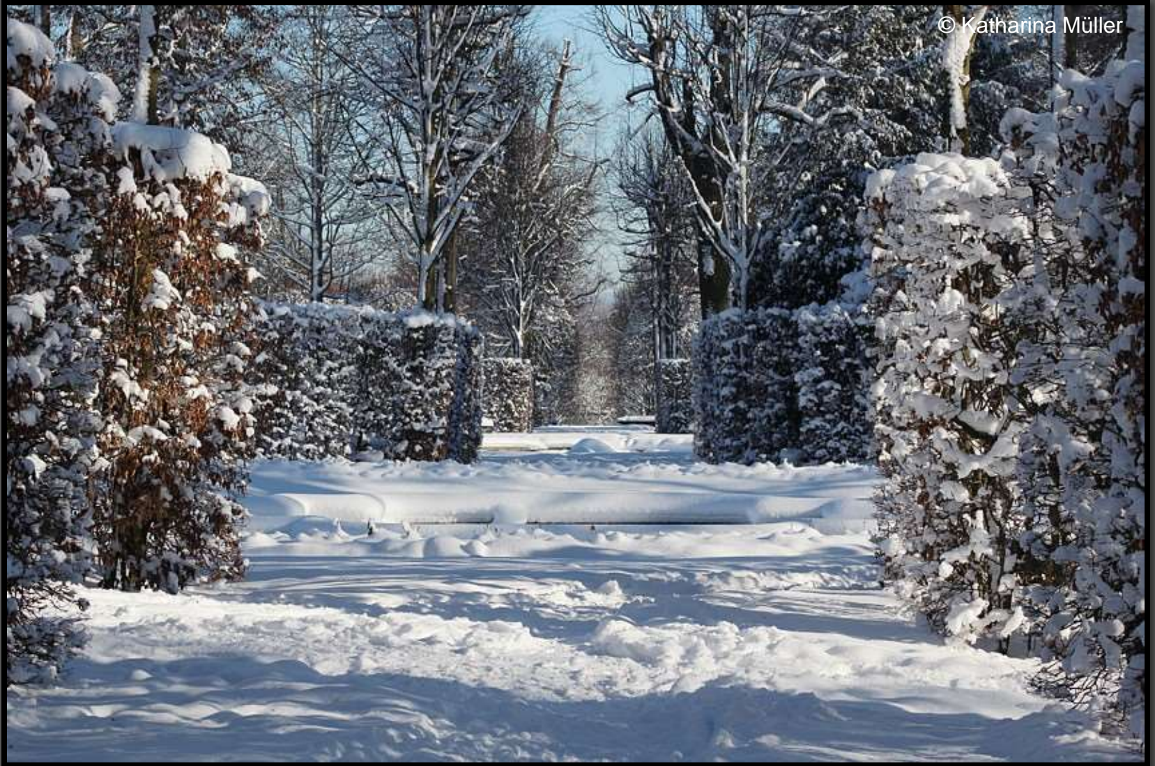
Heckengang mit Vasenstück