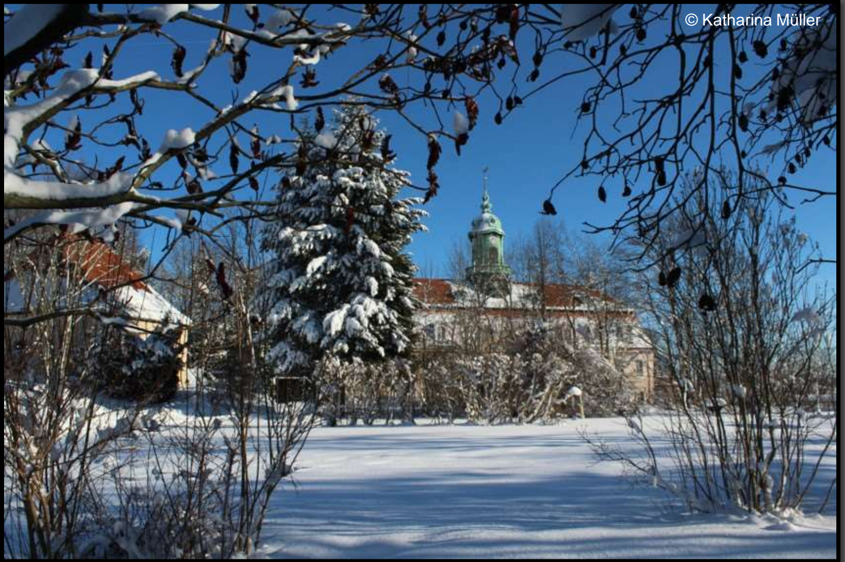
Schloss und Kellerhaus