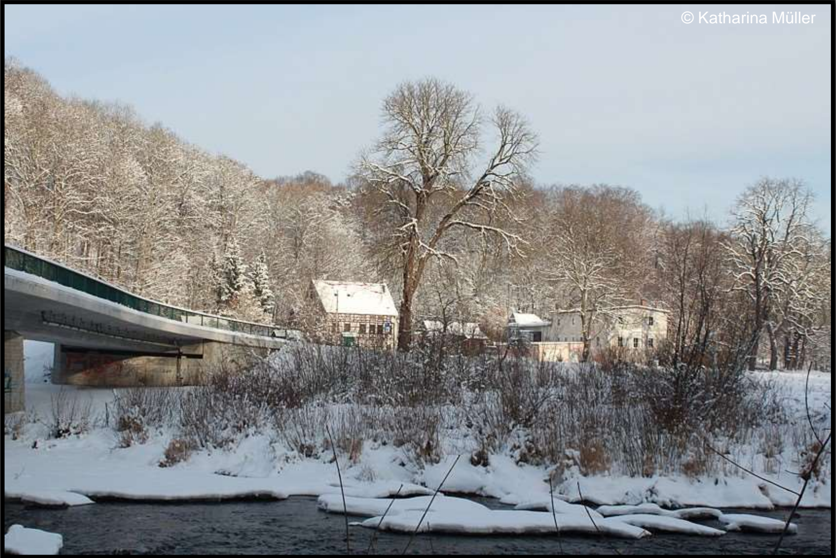
Zschopaubrücke bei Lichtenwalde