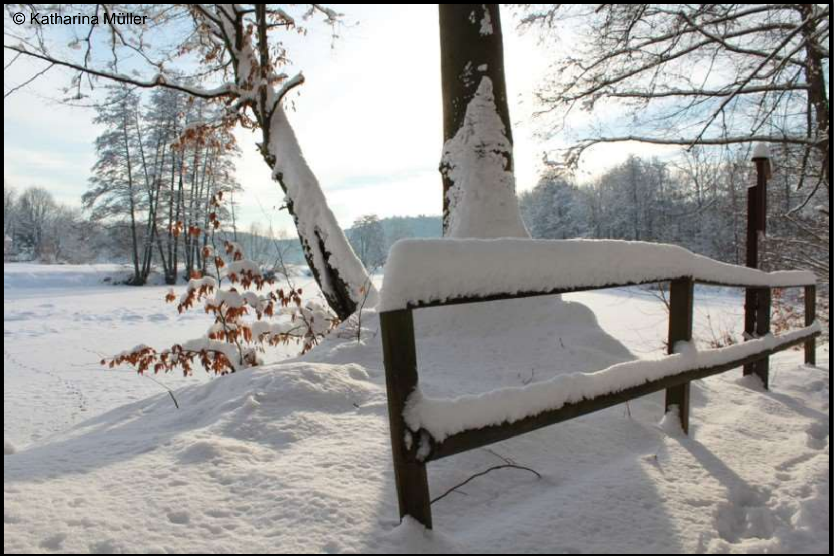
Zschopautalweg bei Lichtenwalde