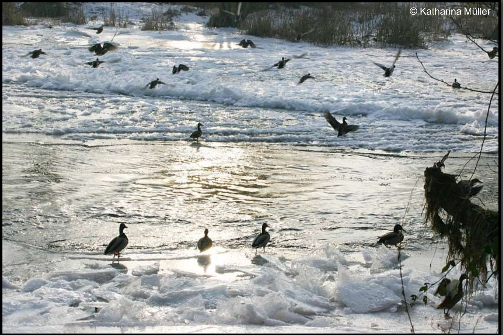
Enten im Eis an der Zschopau