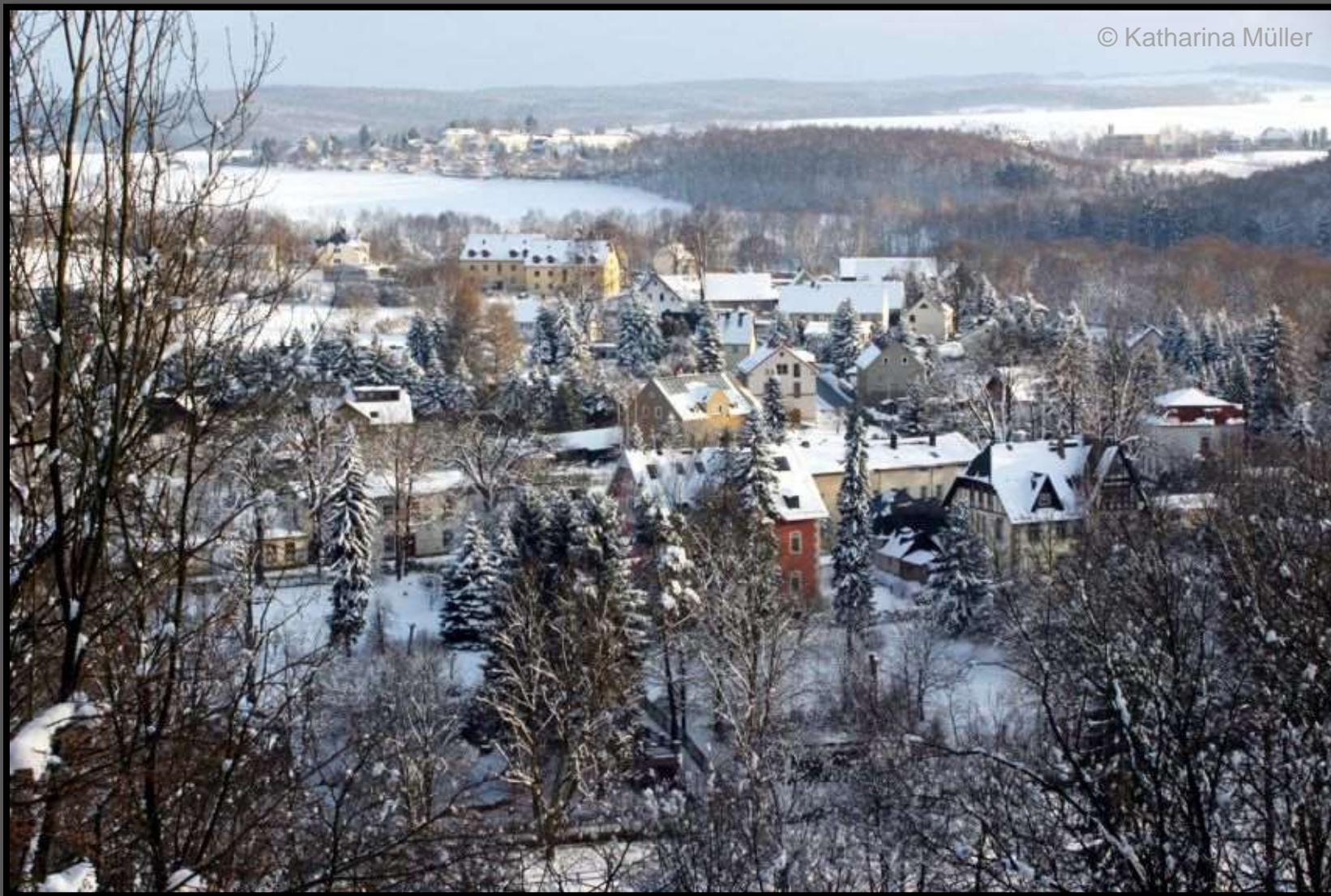
Talblick vom Konzertplatz