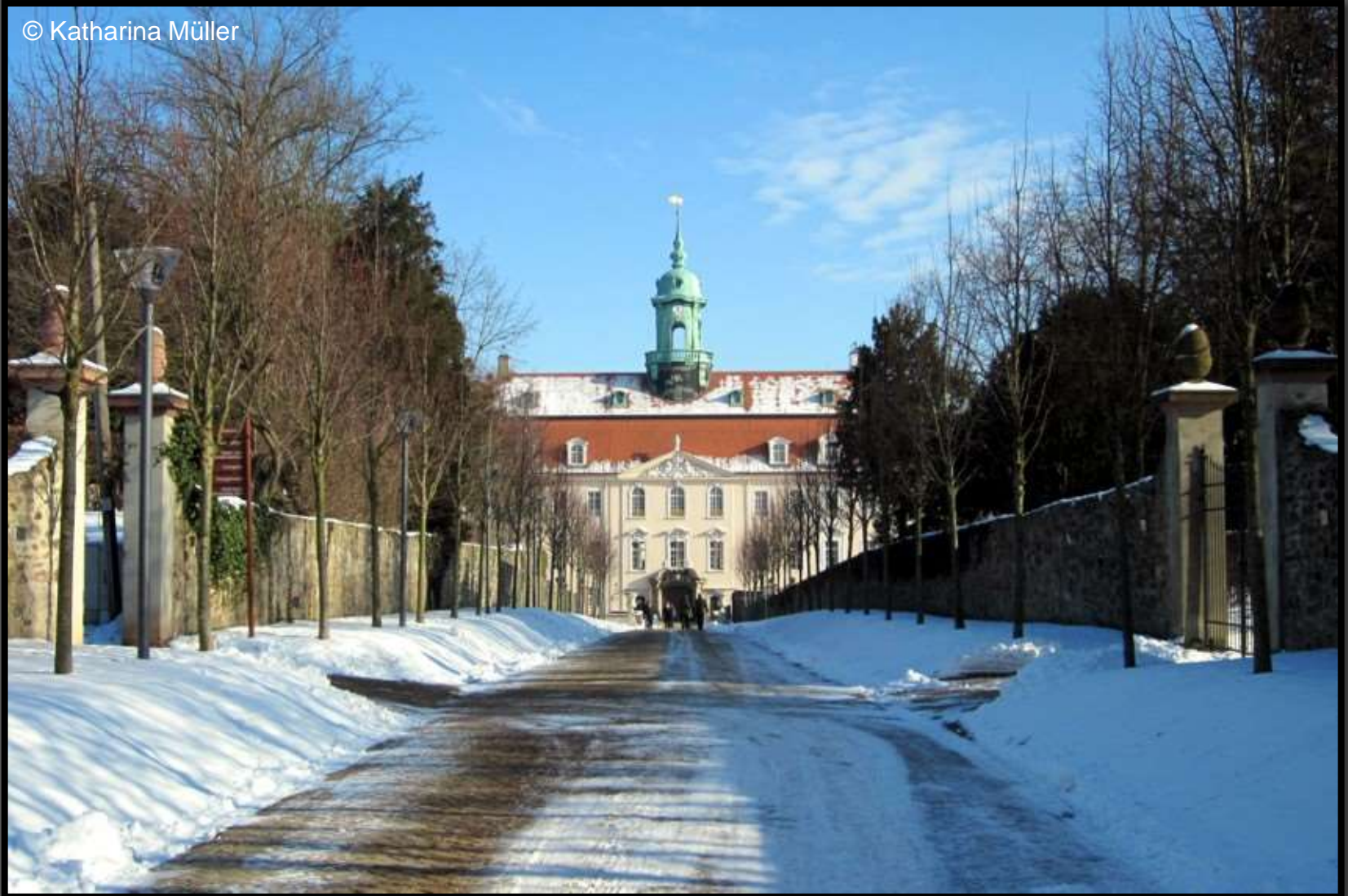
Lindenallee zum Schloss Lichtenwalde