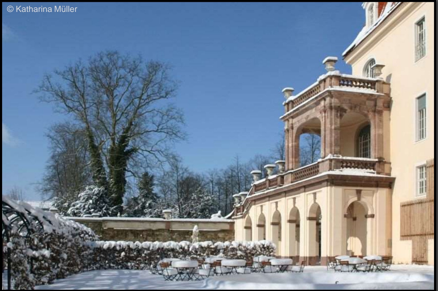
Das vertiefte Parterre mit Altan