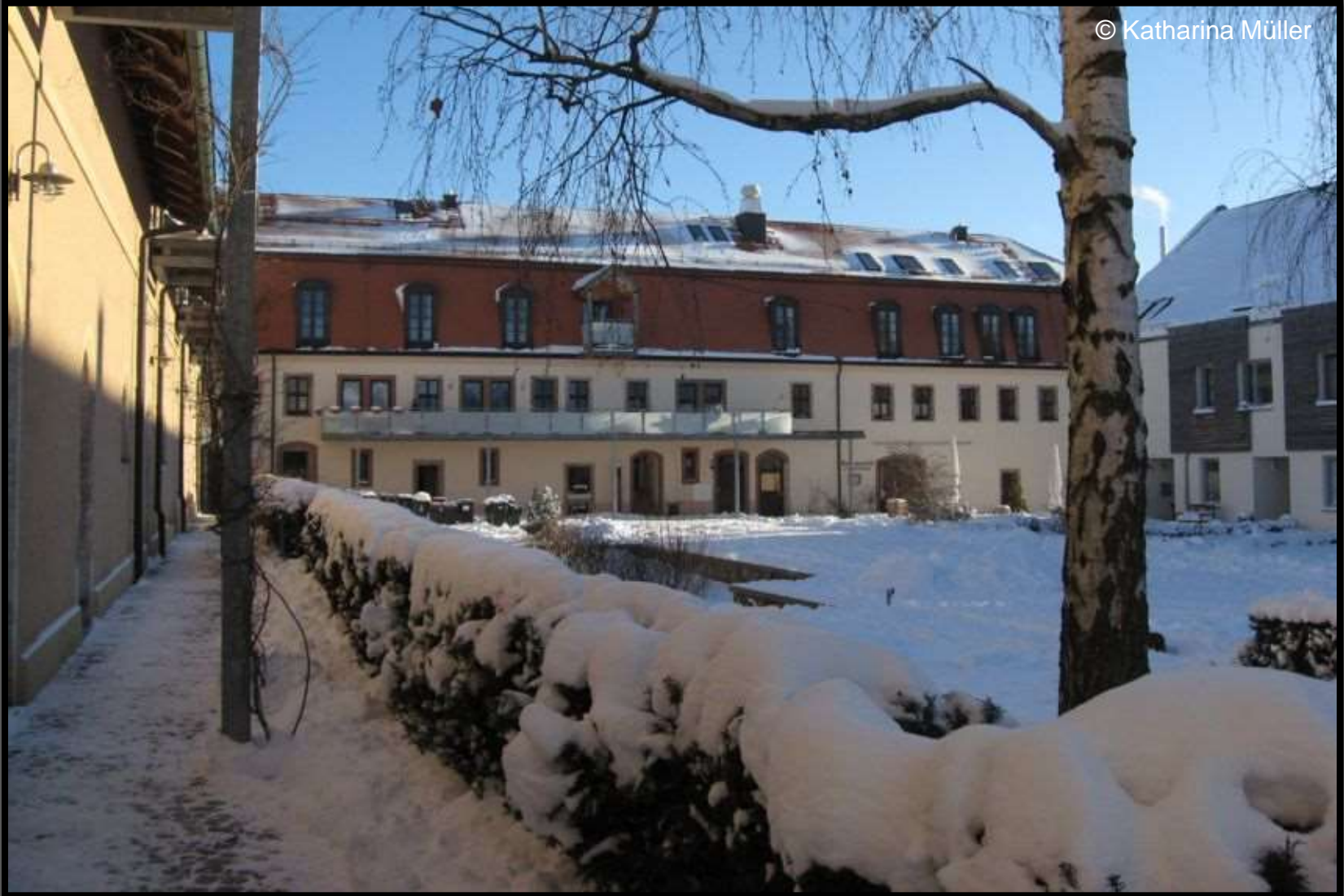
Im Rittergutshof – Blick zur ehemaligen Brennerei