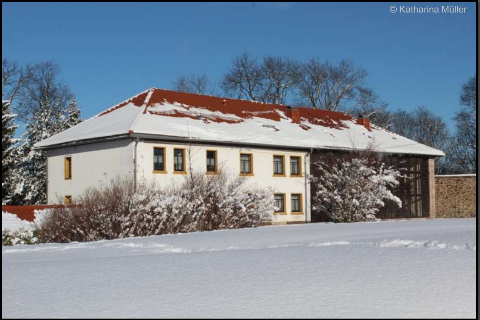
Orangeriegebäude mit Wohnhaus