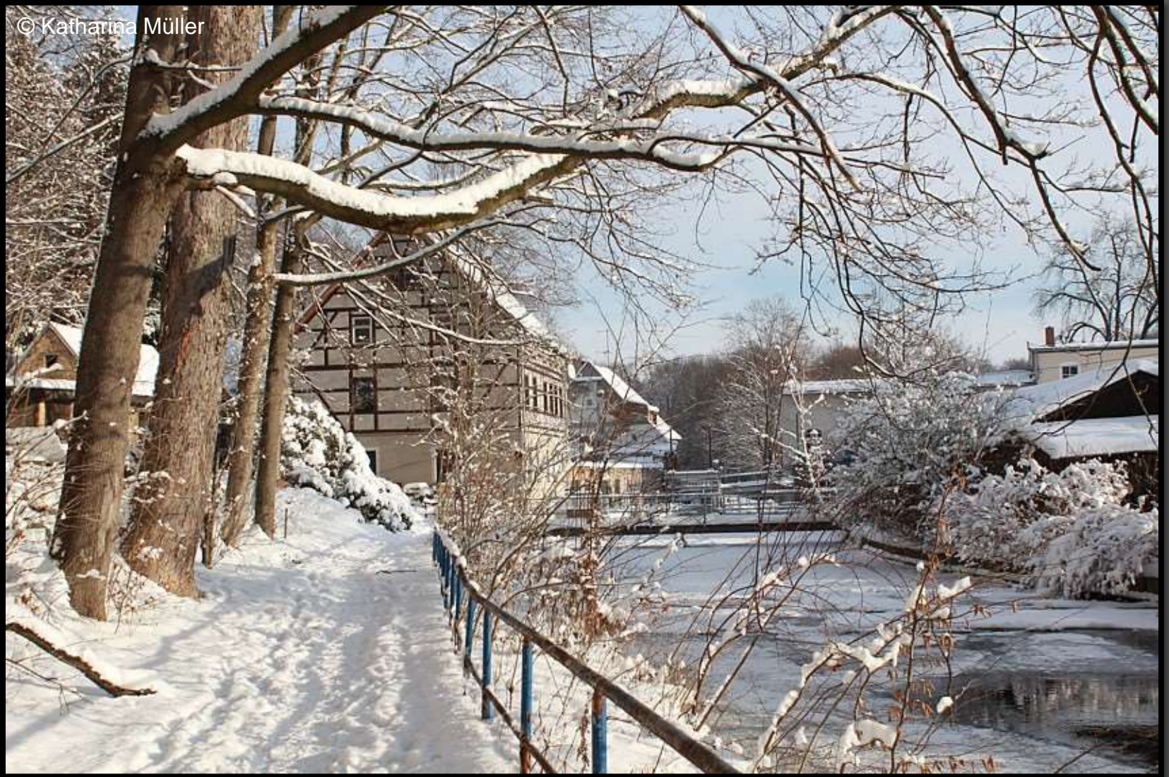
Weg zur Schlossmühle