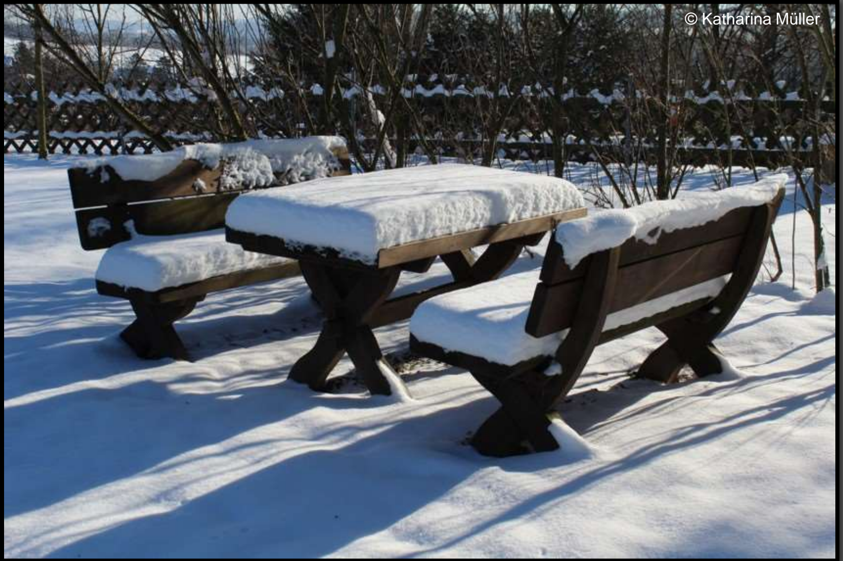
Sitzgruppe im historischen Küchengarten