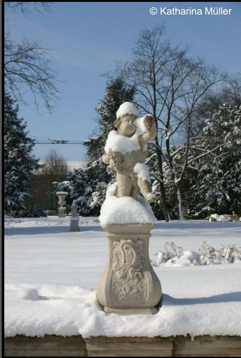
Putte „Herbst“ im Park