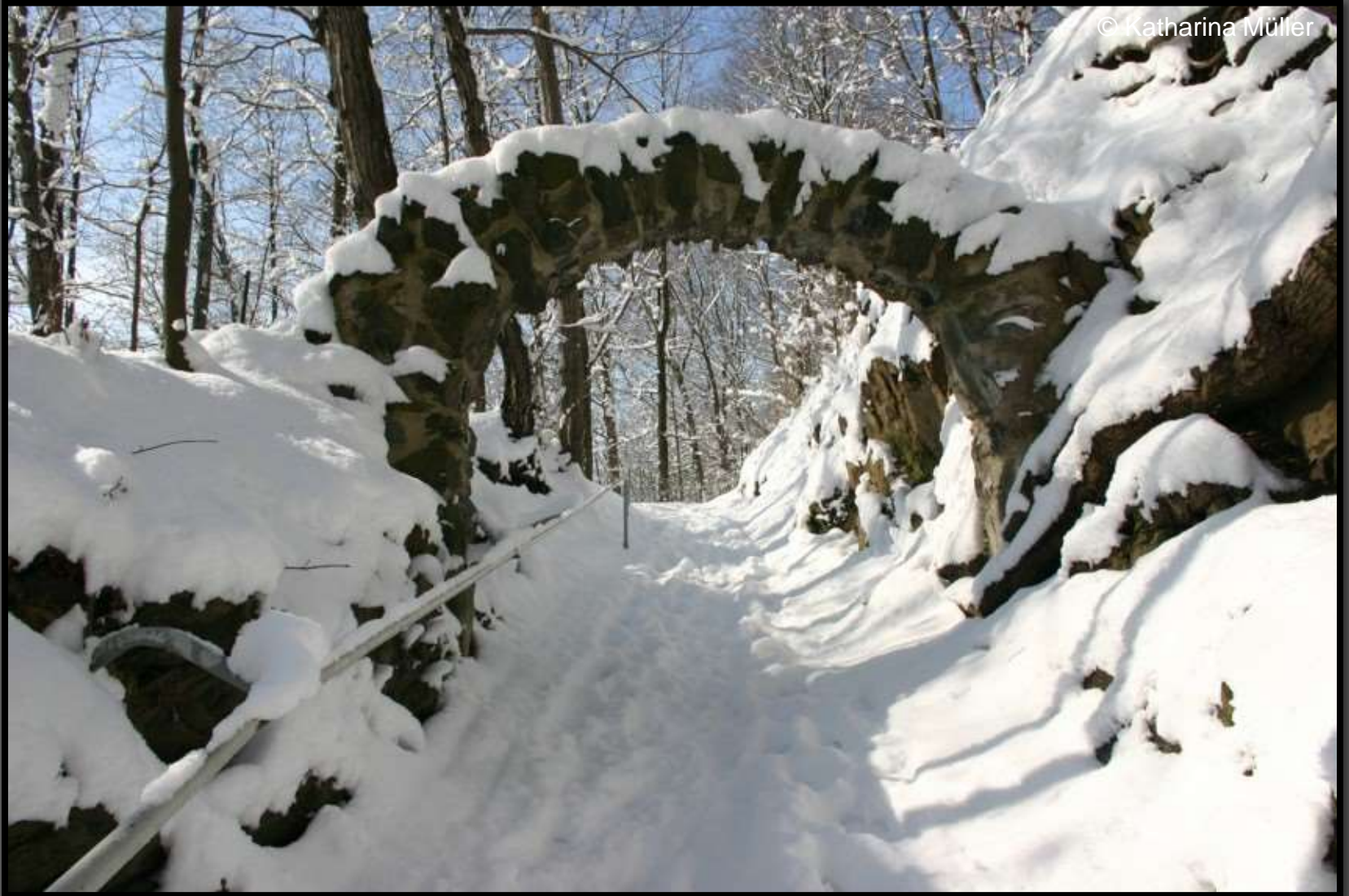
Steintor am Aufstieg zum Schloss