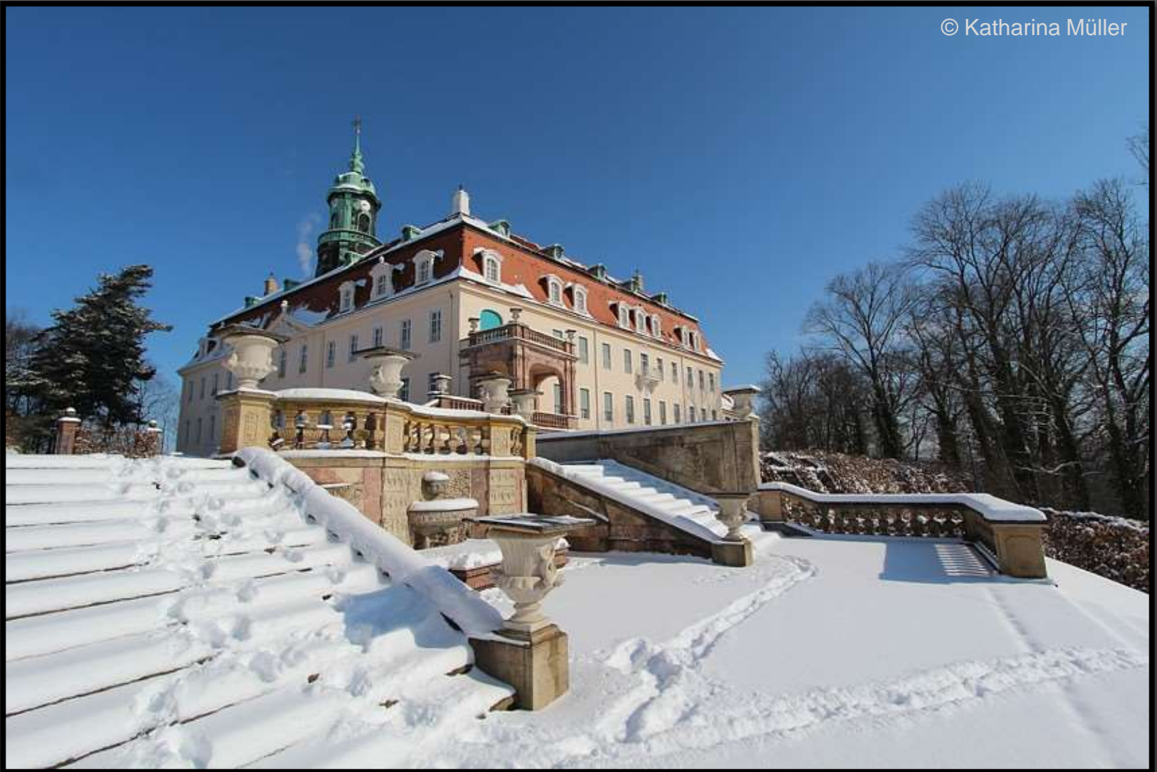
Treppenaufgang am Schloss