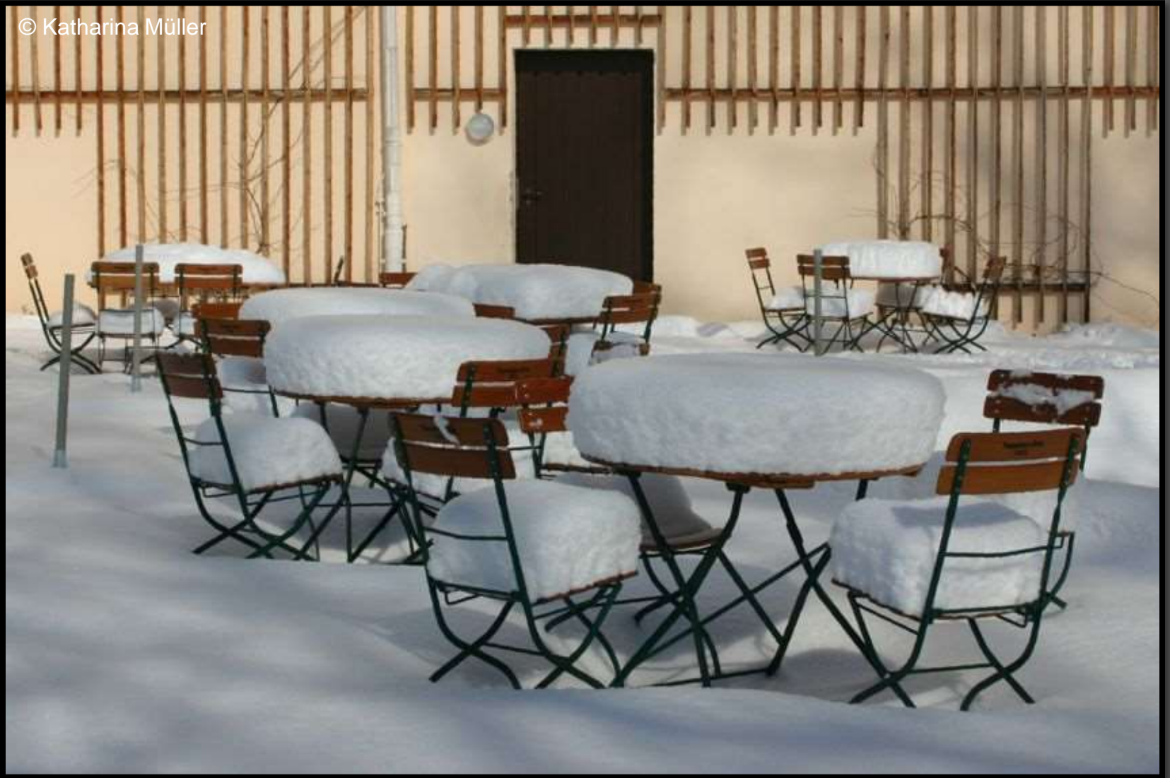
Terrasse vom Schlossrestaurant Vitzthum