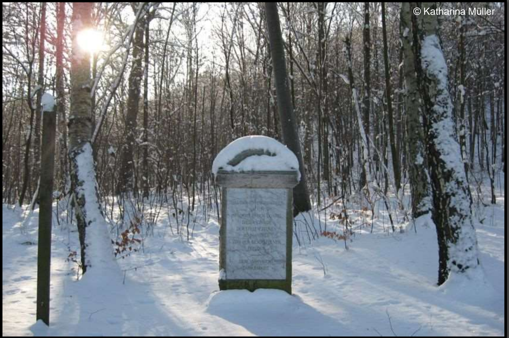
Friedrichstein im Landschaftspark