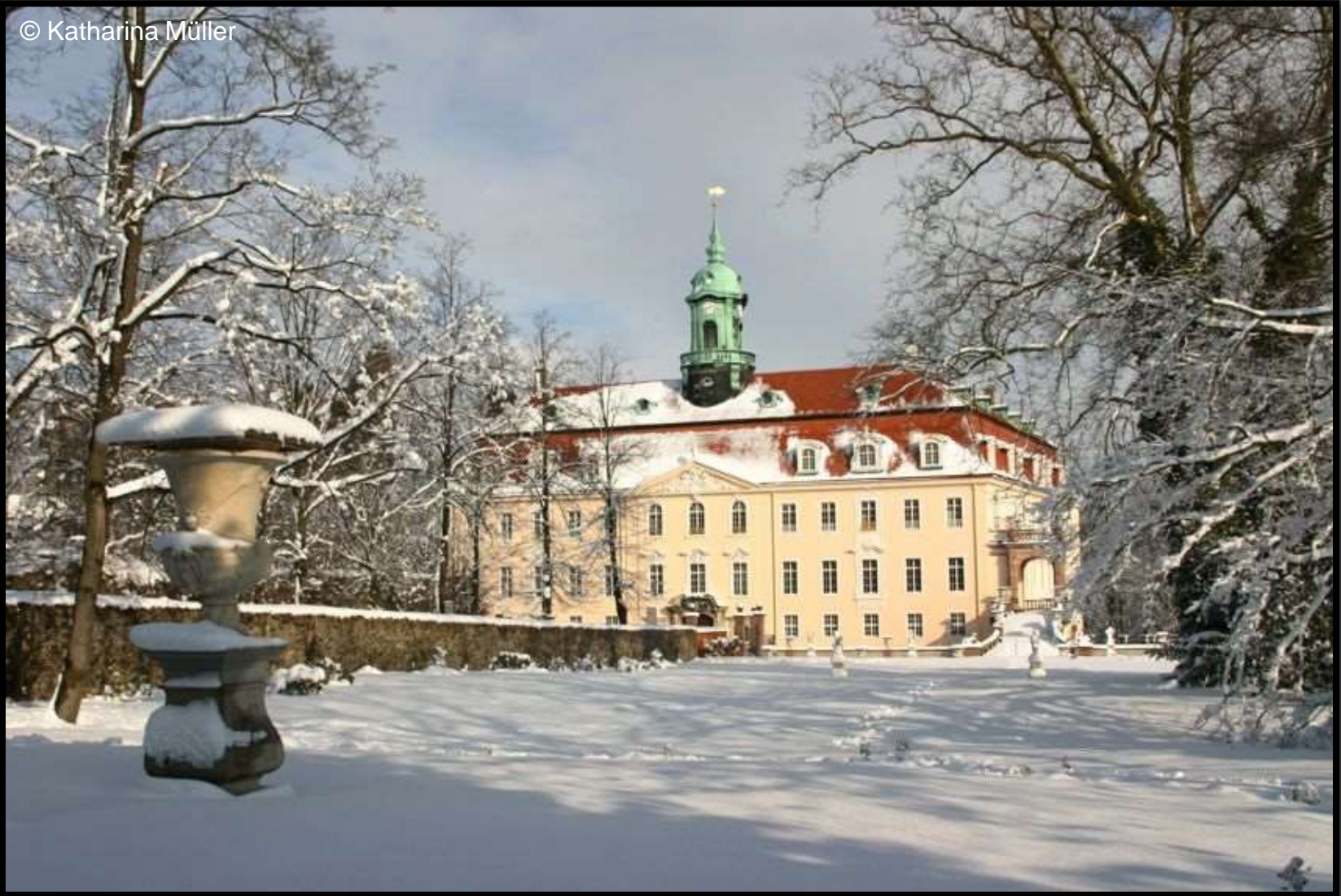
Blick zum Schloss vom Mittelgarten