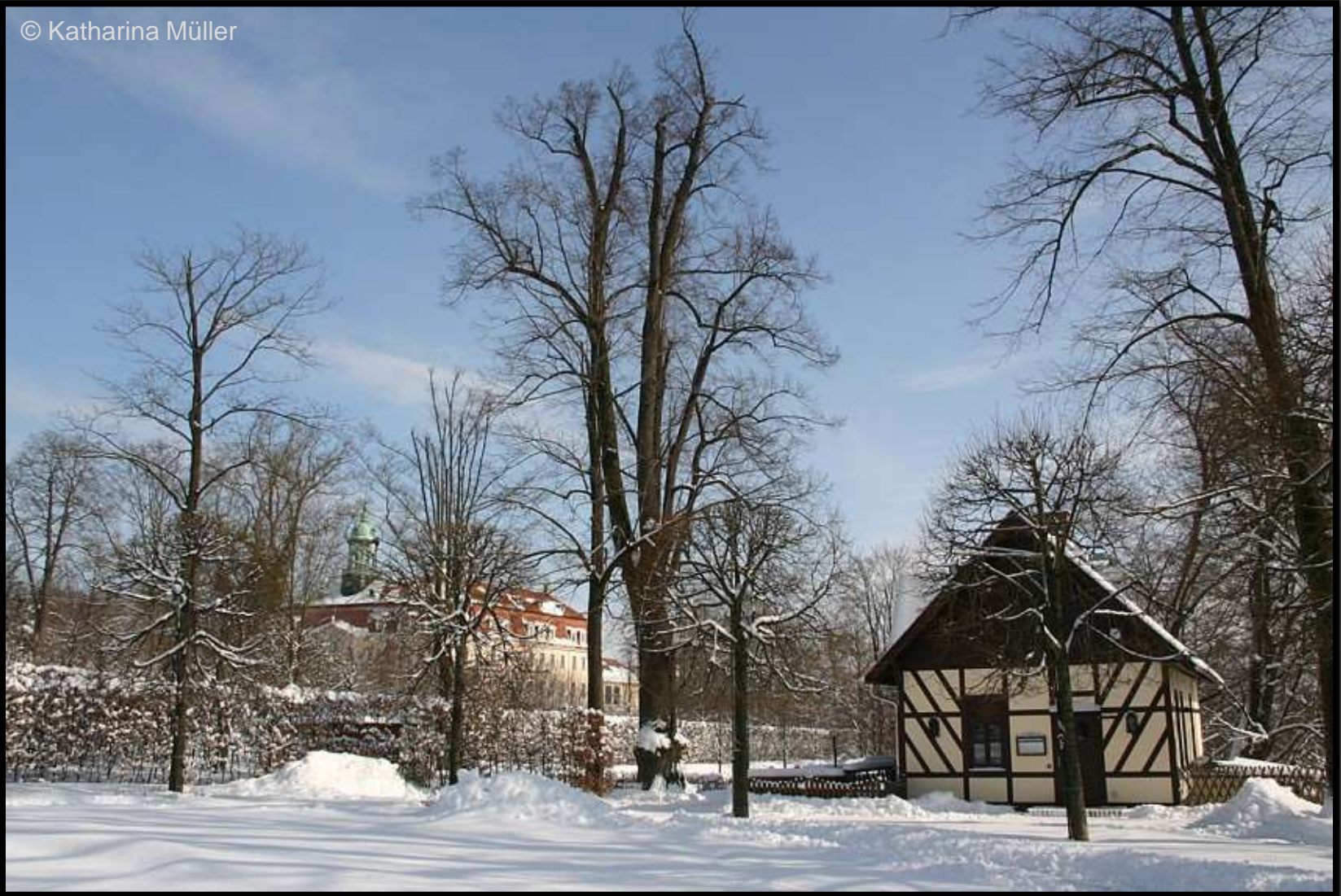
Konzertplatz mit Schloss im Hintergrund