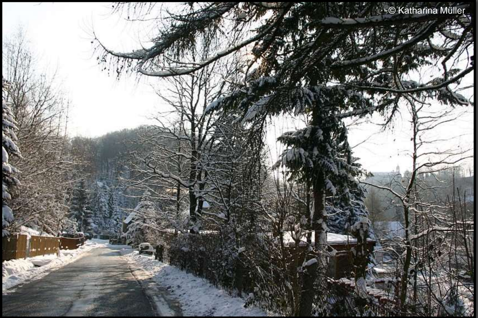
Straße am Kirschberg mit Schloss im Hintergrund