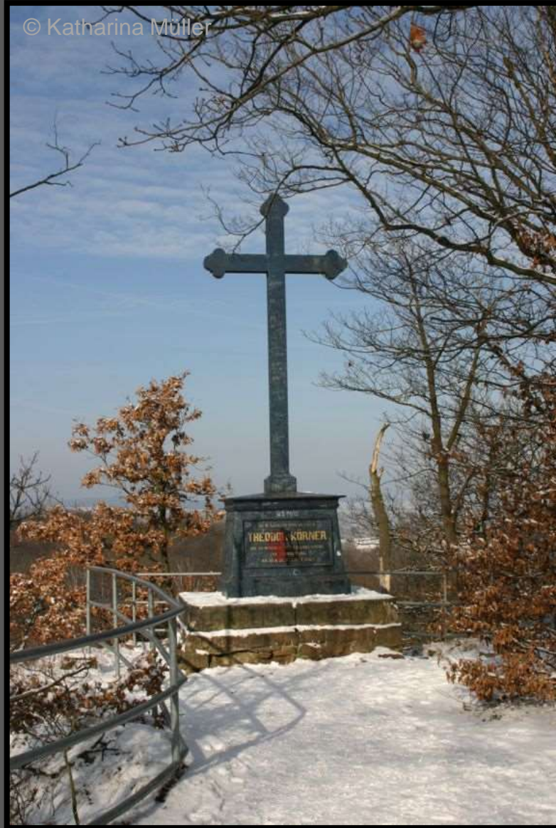
Körnerkreuz auf dem Harrasfelsen