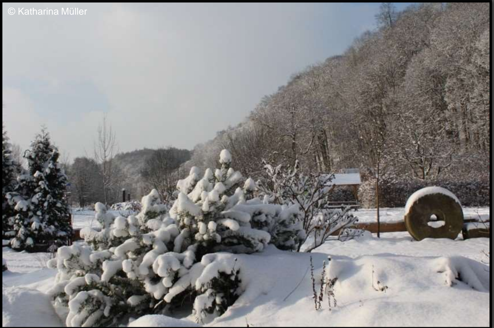
Bei der Lichtenwalder Mühle