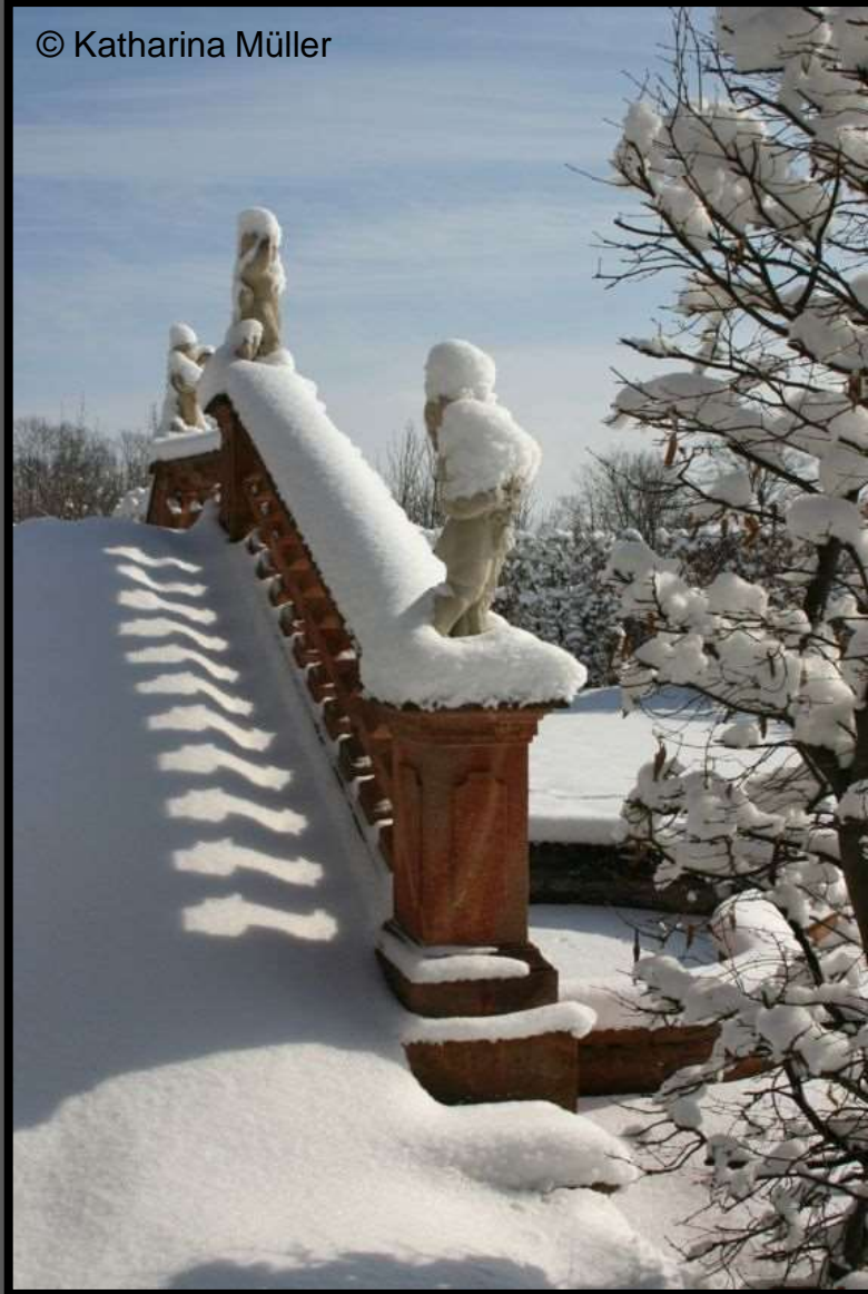
Treppe am Delfinbrunnen